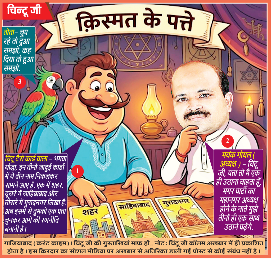
गाजियाबाद (करंट क्राइम)। चिंदू जी की गुस्ताखियां माफ हों... नोट : चिंदू जी कॉलम अखबार में ही प्रकाशित होता है। इस किंवदंती का सोशल मीडिया पर अखबार से अतिरिक्त झाली गैस पोस्ट से कोई संबंध नहीं है।