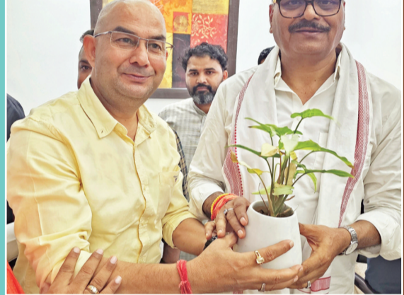
गाजियाबाद (करंट क्राइम)। उत्तर प्रदेश के डिप्टी सीएम बृजेश पाठक के गाजियाबाद आगमन पर नगर निगम कार्यकारीणी उपाध्यक्ष प्रदीप चौधरी ने उनका स्वागत किया। इस अवसर पर दोनों ने केन्द्र सरकार के 12 वर्षों के कार्यकाल की उपलब्धियों पर चर्चा की।