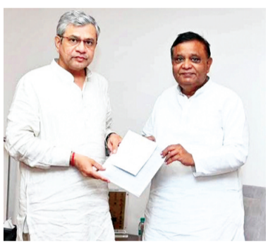
द्वारा अवगत कराया है कि इसकी जांच कराई जा रही है और जांच के बाद आवश्यक और उपयुक्त कार्यवाही की जायेगी। सांसद अतुल गर्ग ने अंडर पास के विस्तारीकरण का विषय प्रमुखता से उठाया। फिलहाल अब इस आश्रसन के बाद समाधान की राह बन रही है।

सांसद अतुल गर्ग ने बताया कि रेल मंत्री ने पत्र द्वारा अवगत कराया है कि इसकी जांच कराई जा रही है और जांच के बाद आवश्यक और उपयुक्त कार्यवाही की जायेगी।