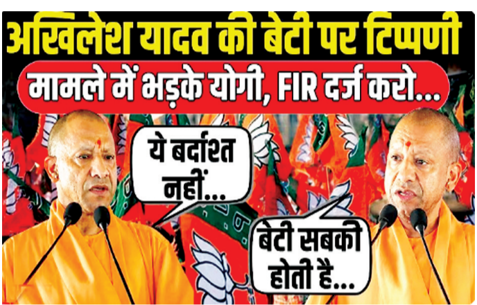
अखिलेश यादव की बेटी पर टिप्पणी मामले में भड़के योगी, FIR दर्ज करो...

आजमगढ़। मैं पिछले दिनों देख रहा था। समाजवादी पार्टी के अध्यक्ष अखिलेश यादव की पुत्री के खिलाफ कुछ लोगों ने गलत टिप्पणियां की थीं। जैसे मेरे संज्ञान में आया। पुलिस से मैंने कहा इसमें एफआईआर दर्ज कराओ, बेटी के खिलाफ कोई भी अपमानजनक टिप्पणी स्वीकार्य नहीं होनी चाहिए। बेटी, बेटी होती है और हम तो संस्कार में हैं। उक्त बातें सीएम योगी आदित्यनाथ ने शनिवार को विश्वविद्यालय परिसर में आयोजित जनसभा को संबोधित करते हुए कही।