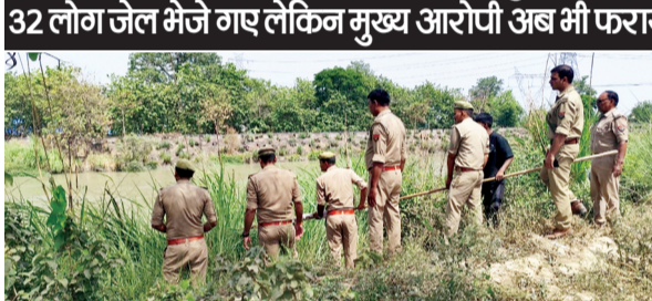
गंग नहर से हाथरस तक खन चुकी खाक 32 लोग जेल भेजे गए लेकिन मुख्य आरोपी अब भी फरार

गाजियाबाद, करंट क्राइम : लोनी के चर्चित दुर्घिया ओमकार हत्याकांड में 11 दिन बीत जाने के बाद भी गाजियाबाद पुलिस को सबसे बड़ी चुनौती मुत्तक का शव बरामद करने की बनी हुई है।