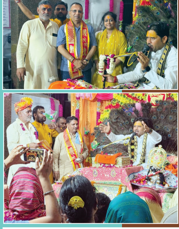
गाजियाबाद (करंट क्राइम)। कविनगर के संकटमोचन मंदिर में चल रहे श्रीमद्भागवत कथा महोत्सव में प्रतिदिन श्रद्धालु आ रहे हैं। कविनगर में आयोजित हो रहे कथा महोत्सव में गुरुवार को भी श्रद्धालुओं ने कथा महोत्सव में भक्ति रस का आनंद लिया। कविनगर के कथा महोत्सव में समाज के गणमान्य लोग पहुंच रहे हैं।