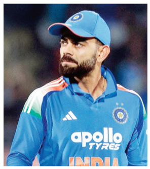
भारत और अफगानिस्तान के बीच मुल्लापुर में एकमात्र टेस्ट मैच खेला जा रहा है।