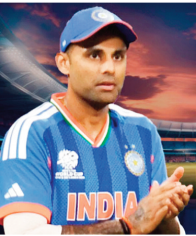
उपकप्तानी का जिम्मा मिला है।

मुंबई। भारतीय टी20 टीम में नए दौर की शुरुआत हो गई है। सूर्यकुमार यादव की कप्तानी और टी20 टीम से छुट्टी हो गई है, जबकि श्रेयस अय्यर खेल के सबसे छोटे प्रारूप में भारत के नए कप्तान बने हैं। वहीं, 45 साल के वैभव सूर्यवंशी को भी सीनियर टीम में पहली बार मौका दिया गया है।