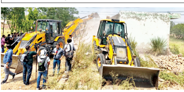
मद्रसा जामिया अरबिया इशातुल इस्लाम को ध्वस्त किया गया।

करंट क्राइम : इस पूरी कार्रवाई में बताया जा रहा है कि राजस्व विभाग की रिपोर्ट के आधार पर उत्तर प्रदेश राजस्व संहिता की धारा-67 के अंतर्गत वाद संचालित किया गया था। तहसीलदार (न्यायिक) एवं असिस्टेंट कलेक्टर प्रथम श्रेणी द्वारा पारित आदेश में भूमि से बेदखली के साथ 1.23 करोड़ रुपये हजाना वसूलने के निर्देश दिए गए थे। आदेश के बावजूद कब्जा नहीं हटाया गया, जिसके बाद प्रशासन ने पुलिस बल की मौजूदगी में ध्वस्त करण की कार्रवाई को अंजाम दिया। कार्रवाई को लेकर सुरक्षा व्यवस्था बेहद कड़ी रखी गई।