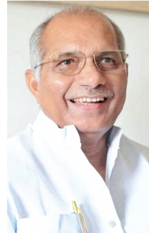
गाजियाबाद, करंट क्राइम। उत्तर प्रदेश के पशुधन तथा दुग्ध विकास मंत्री धर्मपाल सिंह को गाजियाबाद जिले का प्रभारी मंत्री बनाया गया है। प्रभारी मंत्री बनने के बाद धर्मपाल सिंह आज गाजियाबाद आ रहे हैं। उनका