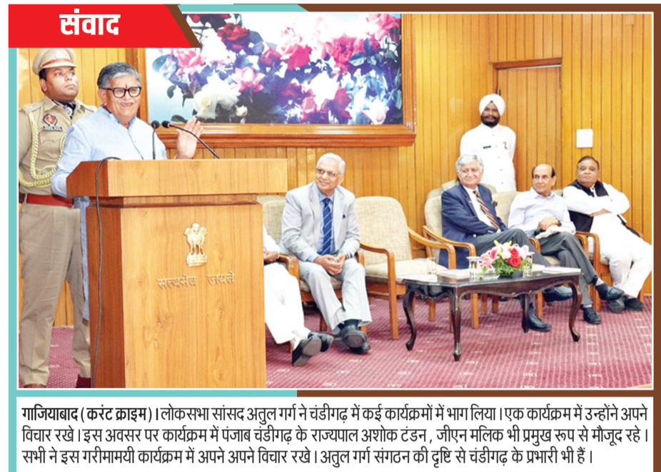
गाजियाबाद (करंट क्राइम)। लोकसभा सांसद अतुल गर्ग ने चंडीगढ़ में कई कार्यक्रमों में भाग लिया। एक कार्यक्रम में उन्होंने अपने विचार रखे। इस अवसर पर कार्यक्रम में पंजाब चंडीगढ़ के राज्यपाल अशोक टंडन, जीएन एलसी भी प्रमुख रूप से मौजूद रहे। सभी ने इस गरीमामयी कार्यक्रम में अपने अपने विचार रखे। अतुल गर्ग संगठन की दृष्टि से चंडीगढ़ के प्रभारी भी हैं।

पश्चिम एशिया में बढ़ते तनाव को लेकर ऊर्जा आपूर्ति और वैश्विक बाजारों पर असर की आशंकाएं बढ़ रही हैं। सुरक्षा एजेंसियों और मंत्रालयों के बीच तालमेल पर जोर: सूत्रों के मुताबिक बैठक में रक्षा, विदेश और सुरक्षा एजेंसियों से जुड़े विभिन्न पहलुओं की समीक्षा की गई। पश्चिम एशिया में जारी अस्थिरता का असर वैश्विक सुरक्षा, ऊर्जा आपूर्ति और सामरिक संतुलन पर पड़ सकता है, जिसे देखते हुए भारत सरकार सतर्क रह कर अपनाए हुए है।