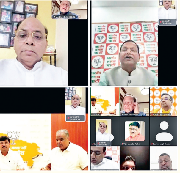
महामंत्री अरुण सिंह ने कार्यकर्ताओं से संगठन को और अधिक मजबूत बनाने तथा हबिश्वास के अभियान को जन-जन तक पहुंचाने का आह्वान किया। वहीं प्रदेश अध्यक्ष पंकज चौधरी ने प्रधानमंत्री नरेंद्र मोदी

गाजियाबाद (करंट क्राइम)। केंद्र सरकार के 12 वर्ष पूर्ण होने के उपलक्ष्य में चलाए जा रहे हबिश्वास के अभियान के अंतर्गत भारतीय जनता पार्टी की प्रदेश स्तरीय वर्चुअल बैठक आयोजित की गई। बैठक में भाजपा के राष्ट्रीय एवं प्रदेश नेतृत्व ने संगठन पदाधिकारियों और कार्यकर्ताओं को आगामी अभियान, जनसंपर्क कार्यक्रमों और केंद्र सरकार की उपलब्धियों को लेकर महत्वपूर्ण मार्गदर्शन दिया। बैठक में भाजपा के राष्ट्रीय महामंत्री एवं राज्यसभा सांसद अरुण सिंह, भाजपा प्रदेश अध्यक्ष एवं केंद्रीय वित्त राज्य मंत्री पंकज चौधरी तथा प्रदेश महामंत्री (संगठन) धर्मपाल सिंह ने संगठन की मजबूती, बूथ स्तर तक सक्रियता और केंद्र सरकार की जनकल्याणकारी योजनाओं को आम जनता तक पहुंचाने पर विशेष जोर दिया। राष्ट्रीय