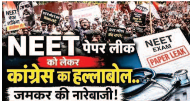
कांग्रेस का हल्लाबोल... जमकर की नारेबाजी!

प्रदर्शन प्रदर्शन के चलते पूरे इलाके में भारी पुलिस बल तैनात किया गया