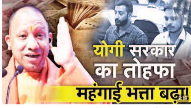
योगी सरकार का तोहफा महंगाई भत्ता बढ़ाया

गुड न्यूज महंगाई भत्ता का भुगतान एक जनवरी 2026 की तिथि से दिया जाएगा