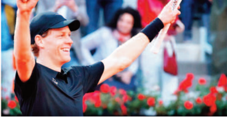
इटली के राष्ट्रपति सर्जियो मैटेरेला भी मुकाबला देखने पहुंचे थे। खिताब जीतने के बाद सिनर ने कहा, '50 साल बाद यह ट्रॉफी फिर इटली आई है। यह मेरे और पूरे देश के लिए बेहद खास पल है।'

इटली। स्टा टेनिस खिलाड़ी यानिक सिनर ने इतिहास रचते हुए इटैलियन ओपन 2026 का खिताब अपने नाम कर लिया। रोम के प्रतिष्ठित फोरो इटालिको में खेले गए फाइनल मुकाबले में दुनिया के नंबर-1 खिलाड़ी सिनर ने नॉर्वे के कैस्पेर रुड को सीधे सेटों में 6-4, 6-4 से हराया। इस जीत के साथ सिनर पिछले 50 वर्षों में इटैलियन ओपन जीतने वाले पहले इतालवी पुरुष खिलाड़ी बन गए। इससे पहले 1976 में एंड्रिआनो पनाटा ने यह खिताब जीता था।