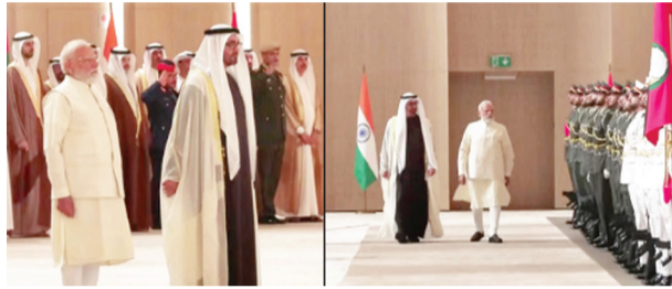
रणनीतिक साझेदारी, विश्वास का प्रतीक-अमित मालवीय भारतीय जनता पार्टी (भाजपा) की आईटी सेल के प्रमुख अमित मालवीय ने एक्स पर वीडियो शेयर किया। उन्होंने लिखा, 'जैसे ही प्रधानमंत्री नरेंद्र मोदी का विमान यूएई के हवाई क्षेत्र में दाखिल हुआ, यूएई के एफ-16 लड़ाकू विमानों ने उसे एस्कॉर्ट किया। यह भारत और यूएई के नेतृत्व के बीच साझा सहरी रणनीतिक साझेदारी, विश्वास और आपसी सौहार्द का एक प्रतीक है।'

नई दिल्ली। प्रधानमंत्री नरेंद्र मोदी पांच देशों के दौर पर हैं। पहले दिन उनका यूएई में भव्य स्वागत हुआ है। यूएई के हवाई क्षेत्र में प्रवेश करने पर एफ-16 जेट विमानों ने प्रधानमंत्री मोदी के विमान को सुरक्षा प्रदान की। इस पर प्रधानमंत्री मोदी ने कहा कि यह भारत के लोगों का सम्मान है। प्रधानमंत्री नरेंद्र मोदी शुक्रवार सुबह नई दिल्ली से अबु धाबी के लिए रवाना हुए। कुछ घंटे के बाद उनके विमान के हवाई क्षेत्र में प्रवेश किया, जहाँ एफ-16 जेट विमानों ने पीएम मोदी के विमान को एस्कॉर्ट किया।