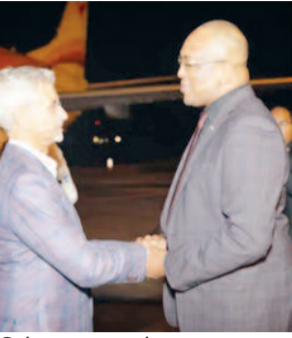
विदेश मंत्रालय ने क्या कहा?

पारामरिबो। विदेश मंत्री एस जयशंकर जमैका के बाद अब सूरीनाम पहुंच गए हैं, जहां राजधानी पारामरिबो में उनके समकक्ष ने उनका गर्मजोशी से स्वागत किया। कैरिबियाई देशों के साथ भारत के संबंधों को मजबूत करने की दिशा में उनकी यह यात्रा अहम मानी जा रही है। भारत के विदेश मंत्री एस जयशंकर बुधवार को सूरीनाम पहुंचे, जहां उनकी वहां के शीर्ष नेतृत्व के साथ द्विपक्षीय वार्ता होने वाली है। तीन कैरिबियाई देशों की यात्रा के दूसरे चरण में उन्होंने अपने समकक्ष मेल्विन बुवा से मुलाकात की, जिन्होंने उनका गर्मजोशी से स्वागत किया।