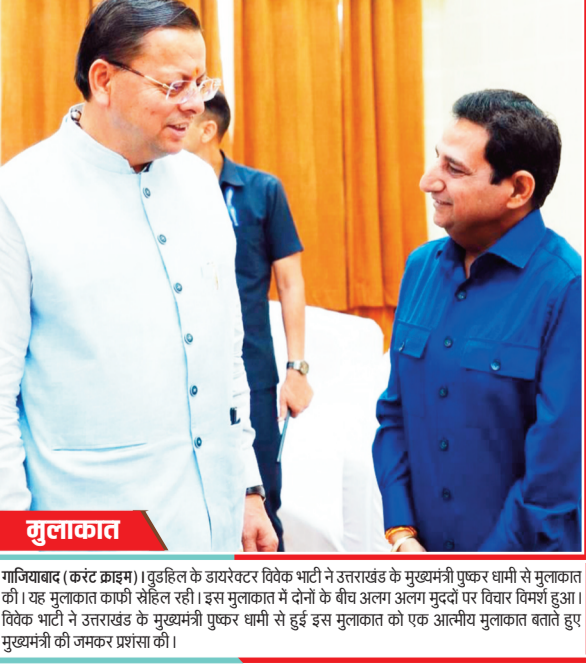
बुलाकात गाजियाबाद (करंट क्राइम)। बुद्धि के डायरेक्टर शिवक भाटी ने उत्तराखंड के मुख्यमंत्री पुष्कर क्षत्री से मुलाकात की। यह मुलाकात काफी सौहार्दपूर्ण रही। इस मुलाकात में दोनों के बीच अलग अलग मुद्दों पर विचार विमर्श हुआ। शिवक भाटी ने उत्तराखंड के मुख्यमंत्री से बुद्धि इनके मुलाकात को एक अतीव मुलाकात बताते हुए मुख्यमंत्री की जमकर प्रशंसा की।

गाजियाबाद, करंट क्राइम : राजनीति में जब बड़े नेता आते हैं तो उनके स्वागत को लेकर कार्यकर्ताओं में जोश होना स्वभाविक सी बात है। लेकिन कई बार खुद को प्रोन्नत करने के चक्कर में जब आसपास के चेहरों को कोई रिजैक्ट करता है तो इसके साइड इफेक्ट रोष के रूप में आते हैं। सूत्र बताते हैं कि यूपी गेट पर भाजपा के राष्ट्रीय पदाधिकारी आ रहे थे। यहां एक महामंत्री भी अपने समर्थकों के साथ थे। इसी बीच एक त्यागी नेता बाउंसरो के साथ आ गये। स्वागत की पहली माला को लेकर विवाद हो गया। गर्मी का मौसम और स्वागत में चाईपास किये जाने पर किसी महामंत्री का खोपड़ा पूरी तरह घूम गया। बताते हैं कि यहां नौक झोंक भी हुई। और इस हद तक नौक झोंक हुई कि स्वागत करवाने वाले राष्ट्रीय पदाधिकारी को भी इंटरफेयर करना पड़ा। उन्हें ये कहना पड़ा कि ये परिपाटी ठीक नहीं है। बताते हैं कि इसके बाद दोनों नेताओं के समर्थक भिड़ गये और यहां पर दिशुम दिशुम वाला सीन भी हो गया। स्वागत को लेकर इस हाथापाई का असर भाजपाई स्वागत में बाद तक नजर आया। बताते हैं कि फिर एक पदाधिकारी ने जानकी भवन वाले स्वागत से खुद को दूर कर लिया। एक पदाधिकारी फिर बाल्गापैलेस में ही रहे। समर्थकों की इस भिड़ंत के बाद तनावनी का माहौल रहा।