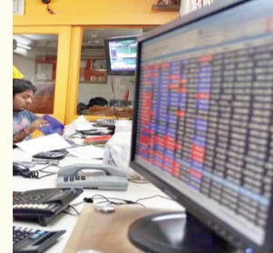
निवेशकों की जोखिम लेने की धारणा

एक्सपर्ट्स ने यह राय जताई है। उन्होंने बताया कि विदेशी निवेशकों की खरीद-विक्री गतिविधियां भी बाजार के रुख को प्रभावित करेंगी।