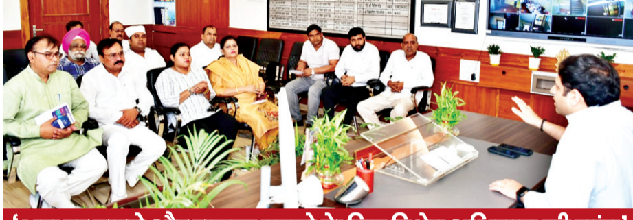
‘भ्रम दूर करने और राजस्व बढ़ाने के लिए विशेष अभियान की मांग’

गाजियाबाद, करंट क्राइम : नगर निगम मुख्यालय में बुधवार को पार्श्वों और नामित पार्श्वों का प्रतिनिधिमंडल नगर आयुक्त से मिला। इस दौरान उन्होंने शहरवासियों को हाउस टैक्स में दी गई छूट के लिए नगर निगम का आभार व्यक्त करते हुए गुच्छ भेंट किया। साथ ही भविष्य की कार्ययोजना और टैक्स व्यवस्था को और प्रभावी बनाने को लेकर विस्तृत चर्चा भी की गई। पार्श्वों ने बताया कि नगर निगम द्वारा 25%, 32.5% और 40% तक की छूट दिए जाने के साथ-साथ कचरा पृथक्करण अपनाने वाले नागरिकों को 10% अतिरिक्त छूट देना एक सराहनीय कदम है। इससे न केवल आम जनता को आर्थिक राहत मिली है, बल्कि स्वच्छता के प्रति जागरूकता