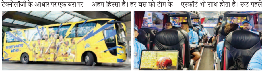
टेक्नोलॉजी के आधार पर एक बस पर अहम हिस्सा है। हर बस को टीम के एस्कॉर्ट भी साथ होता है। रूट पहले

नई दिल्ली। आईपीएल 2026 में टीम बसें साधारण वाहन नहीं बल्कि चलते-फिरते फाइव-स्टार होटल हैं। एक बस की कीमत 70 लाख से 1.5 करोड़ रुपये तक होती है, जिसमें लज्जती सुविधाएं, हाई-टेक सिस्टम और कड़ी सुरक्षा शामिल होती है। ये बसें अब टीम के ट्रांसपोर्ट के साथ-साथ ब्रांडिंग और टीम बॉन्डिंग का भी अहम हिस्सा बन चुकी हैं।