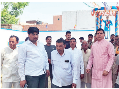
'पंचतीर्थों' का उल्लेख करते हुए इसे बाबा साहेब के प्रति सच्ची श्रद्धांजलि बताया।