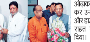
पदाधिकारियों का कहना है कि इस निर्णय से न केवल व्यापारियों को बॉलक आम नागरिकों को भी बड़ी आर्थिक राहत मिलेगी। उन्होंने कहा कि सरकार जनहित के मुद्दे पर संवेदनशीलता के साथ कार्य कर रही है। पदाधिकारियों ने उम्मीद जताई कि भविष्य में भी इसी प्रकार के जनकल्याणकारी निर्णय लिए जाते रहेंगे, जिससे प्रदेश के व्यापारियों और नागरिकों को लाभ मिलता रहे।