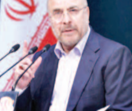
ईरानी सरकारी मीडिया और अल-जजीरा की रिपोर्ट के अनुसार, गालिबाफ ने कहा कि तेहरान ने बातचीत के दौरान 'बहुत अच्छे प्रस्ताव' दिए हैं, जिससे बातचीत आगे बढ़ी है। उन्होंने कहा, ट्रंप की हाल की धमकियों का ईरानी जनता पर कोई असर नहीं है।

तेहरान। ईरान के संसद अध्यक्ष मोहम्मद बाकेर गालिबाफ ने कहा कि अमेरिकी राष्ट्रपति की धमकियों का ईरान पर कोई असर नहीं है और ईरान अपनी रूख पर कायम रहेगा। उन्होंने चेतावनी दी कि ईरान दबाव में नहीं झुकेगा। ईरान के संसद अध्यक्ष मोहम्मद बाकेर गालिबाफ ने कहा कि अमेरिकी राष्ट्रपति डोनाल्ड ट्रंप की हाल की धमकियों का ईरानी जनता पर कोई असर नहीं पड़ता। उन्होंने कहा, ये धमकियां बेअसर हैं और ईरान अपने रूख पर मजबूत रहेगा। हालांकि, उन्होंने यह भी संकेत दिया कि ईरान और अमेरिका के बीच बातचीत में कुछ प्रगति हो रही है।