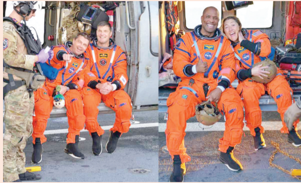
जब ईसाओं ने चंद्रमा के पास जाकर फ्लाइंग किया।

वाशिंगटन। नासा का आर्टेमिस-2 मिशन सफलतापूर्वक पूरा हो गया है। 10 दिन की ऐतिहासिक चंद्र यात्रा के बाद चारों अंतरिक्ष यात्री शनिवार तड़के प्रशांत महासागर में सुरक्षित लैंडिंग के साथ पृथ्वी पर लौट आए। यह मिशन कई मायनों में ऐतिहासिक रहा और भविष्य में चंद्रमा पर स्थायी मानव उपस्थिति की दिशा में बड़ा कदम माना जा रहा है।