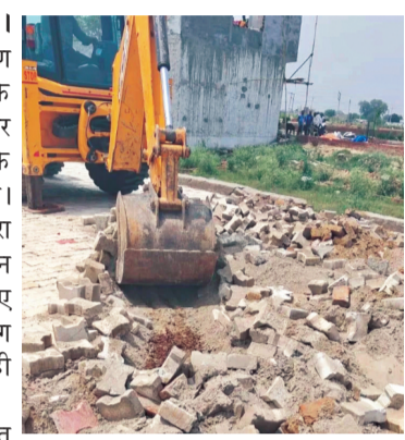
दस्ते ने प्रभावी कार्रवाई करते हुए कार्यवाही पूरी की। कार्यवाही के दौरान सहायक अभियंता, अवर अभियंता, प्रवर्तन जोन-2 का समस्त स्टाफ, प्राधिकरण पुलिस बल और प्रवर्तन दस्ते मौजूद रहे। जीडीए ने इस कार्रवाई को अवैध निर्माण और अनाधिकृत कॉलोनियों के प्रति सख्त संदेश के रूप में पेश किया।

गाजियाबाद (करंट क्राइम)। गाजियाबाद विकास प्राधिकरण (जीडीए) ने उपाध्यक्ष के निर्देशानुसार अवैध निर्माण और अनाधिकृत कॉलोनियों के खिलाफ कड़ी कार्रवाई की। आज ग्राम भिक्रनपुर के खसरा नंबर 475 में प्रभारी प्रवर्तन जोन-02 के नेतृत्व में जीडीए की टीम ने अवैध रूप से प्लॉटिंग कर विकसित की जा रही कालोनी को ध्वस्त कर दिया। स्थल पर कोई स्वीकृत तलपट मानचित्र प्रस्तुत नहीं किया गया। इसके परिणामस्वरूप कालोनाईजर द्वारा बनाई गई सड़क, बाउंड्री वॉल, साइट ऑफिस सहित अन्य अवैध निर्माणों को पूरी तरह से ध्वस्त किया गया। ध्वस्तीकरण के दौरान कालोनाईजर और निर्माण कालोनी के प्रति सख्त संदेश के रूप में पेश किया।