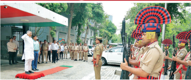
सभापति को दिया गया गार्ड ऑफ ऑनर