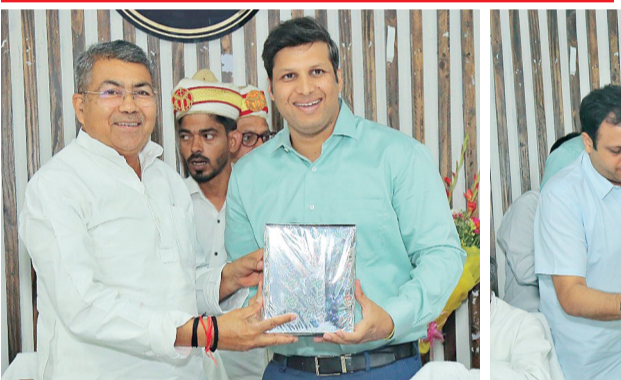
समयबद्ध कार्यवाही या उत्तर भेजा गया है तथा सभी कार्यालयों में जनप्रतिनिधियों के लिए रजिस्ट्रेशन भी बनाया गया है।