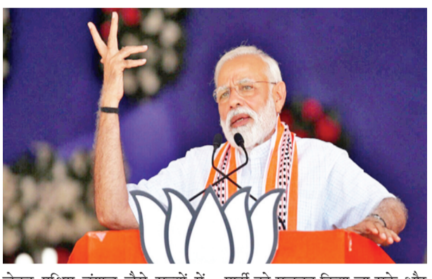
लेकर पश्चिम बंगाल जैसे राज्यों में राजनीतिक हिंसा तक हर तरह की कठिनाइयों का सामना किया है, ताकि पार्टी को मजबूत किया जा सके और राष्ट्र की सेवा की जा सके।

स्थापना दिवस देश जानता है, हर चुनौती का सामना करने के लिए भाजपा ईमानदारी से कोशिश कर रही है: मोदी