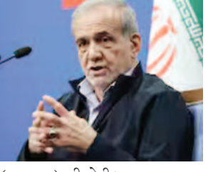
(इराक) की होगी। इरान ने अमेरिका को क्या कड़ी चेतावनी दी?

तेहरान। फारस की खाड़ी और होर्मुज को लेकर इरान और अमेरिका के बीच तनावनी एक बार फिर बहुत ज्यादा बढ़ गई है। 'फारस की खाड़ी राष्ट्रीय दिवस' के मौके पर इरान के राष्ट्रपति मसूद पेजेशकियान ने अमेरिका और इराक को बहुत ही कड़ी चेतावनी दी है। उन्होंने साफ शब्दों में कह दिया है कि इरान किसी भी विदेशी दबाव, समुद्री नाकाबंदी या धमकियों के आगे झुकने वाला देश नहीं है और वह डटकर इसका सामना करेगा।