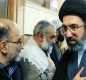
सर्वोच्च नेता मोजतबा खामेनेई ने क्या कहा?

दुबई। पश्चिम एशिया में अस्थायी संघर्ष विराम के बाद अतिरिक्तता और तनाव का माहौल बना हुआ है। अमेरिकी राष्ट्रपति डोनाल्ड ट्रंप की लगातार चेतावनियों के बीच इरान के सर्वोच्च नेता ने कहा कि उनका देश अपनी मिसाइल व परमाणु क्षमताओं की रक्षा करेगा। इरान के सर्वोच्च नेता अयातुल्ला मोजतबा खामेनेई ने गुमराव को कहा कि उनका देश अपनी परमाणु और मिसाइल क्षमताओं की रक्षा करेगा और उन्हें एक राष्ट्रीय संपत्ति मानता है। उनका यह बयान ऐसे समय में आया है, जब अमेरिका के राष्ट्रपति डोनाल्ड ट्रंप इन मुद्दों पर किसी तरह का समझौता चाहते हैं। एसीएफ्टेड प्रेस की रिपोर्ट के मुताबिक, मोजतबा खामेनेई ने यह बयान एक लिखित संदेश में दिया। इसे इरान के सरकारी टेलीविजन पर पढ़कर सुनाया गया। उन्होंने अपने