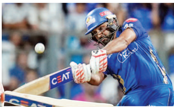
शतक लगाकर उन्होंने यह उपलब्धि हासिल की। यह दिखाना है कि टेस्ट हो, वनडे या टी20, रोहित हर जगह फिट बैठते हैं।

भी उनका जलवा बरकरार है। आईसीसी टूर्नामेंट्स के असली हीरो बड़े मंच पर बड़ा खिलाड़ी बनना हर किसी के बस की बात नहीं होती, लेकिन रोहित इसमें भी सबसे आगे हैं। आईसीसी