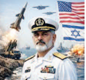
दुश्मन की कोशिश पूरी तरह नाकाम रही