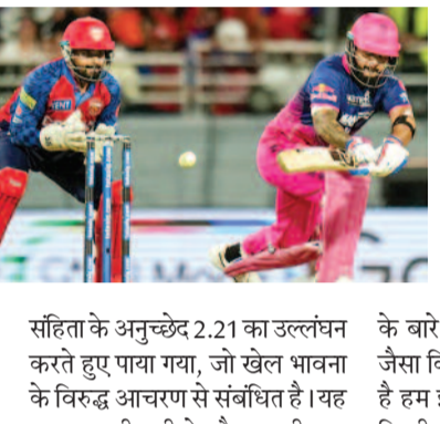
संहिता के अनुच्छेद 2.21 का उल्लंघन करते हुए पाया गया, जो खेल भावना के विरुद्ध आचरण से संबंधित है। यह घटना दूसरी पारी के दौरान घटी जब रियान को ड्रेसिंग रूम के अंदर घेप का इस्तेमाल करते हुए देखा गया। बीसीसीआई टीम, उनके अधिकारी और खिलाड़ियों पर कड़ी कार्रवाई की प्रक्रिया के लिए अन्य विकल्प भी तलाश रहा है जिससे आईपीएल की प्रतिष्ठता बरकरार रहे।

नई दिल्ली। राजस्थान रॉयल्स के कप्तान रियान पराग पर भारतीय क्रिकेट बोर्ड (बीसीसीआई) ने बड़ी कार्रवाई की है। पंजाब किंग्स के खिलाफ मैच के दौरान रियान ने आईपीएल की आचार संहिता का उल्लंघन किया था। राजस्थान रॉयल्स के कप्तान रियान पराग पर भारतीय क्रिकेट कंट्रोल बोर्ड (बीसीसीआई) ने बड़ी कार्रवाई की है। रियान पर मैच फीस का 25 प्रतिशत जुर्माना लगाया है, जबकि आईपीएल की आचार संहिता के लेवल 1 के उल्लंघन पर उनके खाता में एक डिमेरिट अंक जोड़ा गया है। रियान ने राजस्थान और पंजाब किंग्स के खिलाफ आईपीएल 2026 के 40वें मैच के दौरान आचार संहिता का उल्लंघन किया था जिसे लेकर अब कार्रवाई की गई है।