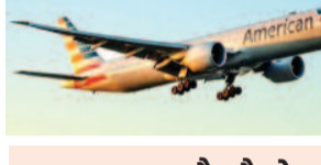
यह फ्लाइट क्यों है इतनी अहम?

काराकास। अमेरिका और वेनेजुएला के बीच सात साल बाद सीधी हवाई सेवा फिर शुरू हो रही है। पहली फ्लाइट मिगामी से काराकास पहुंचेगी। 2019 में सुरक्षा कारणों से यह सेवा बंद कर दी गई थी। अब कूटनीतिक संबंध बहाल होने के बाद यह कदम उठाया गया है। इससे यात्रियों को सीधी यात्रा और व्यापार को बढ़ावा मिलने की उम्मीद है।