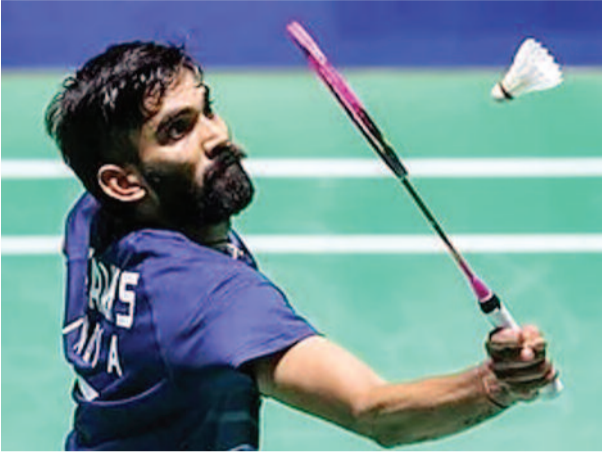
शानदार संघर्षपूर्ण जीत दर्ज करते हुए दूसरे दौर में जगह बनाई और साथ ही खेल परिस्थितियों को लेकर उठे विवाद पर अपनी स्पष्ट राय रखी।

नई दिल्ली। इंडिया ओपन 2026 में पीवी सिंधू को पहले दौर में वियतनाम की गुयेन थुई लिन्ह से हार झेलनी पड़ी, जबकि किदांबी श्रीकांत ने जीत दर्ज कर अगले दौर में जगह बनाई। मैच के बाद श्रीकांत ने स्टेडियम की व्यवस्थाओं को लेकर उठे विवाद पर प्रतिक्रिया देते हुए कहा कि उन्हें खेल परिस्थितियों में कोई बड़ी कमी नजर नहीं आई।