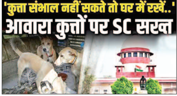
'कुत्ता संभाल नहीं सकते तो घर में रखें..' आवारा कुत्तों पर SC सरत

नई दिल्ली। सुप्रीम कोर्ट ने मंगलवार (13 जनवरी) को आवारा कुत्तों के मामले पर अहम सुनवाई करते हुए कड़ी टिप्पणी की है। सुप्रीम कोर्ट में रिहायशी इलाकों में आवारा कुत्तों के आतंक पर संकेत दिया कि वह आवारा कुत्तों के हमलों से होने वाली किसी भी चोट या मौत के लिए नागरिक अधिकारियों और कुत्ते पालने वालों दोनों को उत्तरदायी ठहरा सकता है। शीर्ष अदालत ने टिप्पणी की है कि जो लोग आवारा कुत्तों को लेकर चिंतित हैं, उन्हें अपने घरों में ले जाना चाहिए, बजाय इसके कि उन्हें 'इधर-उधर घूमने, काटने और जनता को डराने' दिया जाए। यह मौखिक टिप्पणी तब आई