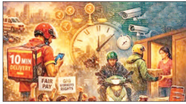
कर दिया है, जो पहले ₹10 मिनट में 10,000 से अधिक उत्पाद हुआ करती थी। इस नीतिगत बदलाव के पीछे मुख्य कारण डिलीवरी पार्टनर्स पर पड़ने वाला मानसिक और शारीरिक दबाव है। सार्वजनिक मंचों पर यह बहस तेज थी कि अत्यधिक दबाव और कभी-कभी खराब मौसम की स्थिति में ये कर्मचारी 'दर्द और दुख' का सामना करते हैं। संसद के हालिया सत्र में भी विवेक कॉमर्स कंपनियों की कार्यप्रणाली पर सवाल उठाए गए थे। आम आदमी पार्टी (अहद) के राज्यसभा सांसद राघव चड्ढा ने गिग वर्कर्स के लिए उचित वेतन, सम्मान और सुरक्षा की मांग करते हुए नियामक ढांचे की आवश्यकता पर जोर दिया था। उन्होंने तर्क दिया कि पेप-आधारित डिलीवरी व्यवसायों को सामाजिक सुरक्षा लाभ प्रदान करने के लिए जवाबदेह बनाया

नई दिल्ली। भारत के तेजी से बढ़ते विवेक कॉमर्स सेक्टर में एक बड़े नीतिगत बदलाव के तहत, केंद्र सरकार ने '10 मिनट की डिलीवरी' की अनिवार्य समय सीमा को समाप्त करने का निर्देश दिया है। केंद्रीय श्रम एवं रोजगार मंत्री मनसुख मांडविया के हस्तक्षेप के बाद, बिल्किट, जेप्टो, जोमेटो और स्विगी जैसे प्रमुख एग्रीगेटर्स ने इस दबावपूर्ण डेडलाइन को हटाने पर सहमत वित्त की है। यह कदम सीधे तौर पर लाखों 'गिग वर्कर्स' की सुरक्षा और उनके कामकाजी हालातों को बेहतर बनाने के उद्देश्य से उठाया गया है। सरकार के इस निर्देश का असर धरातल पर दिखने लगा है। सूत्रों के अनुसार, बिल्किट ने अपनी ब्रांडिंग से '10 मिनट' का वादा हटा दिया है। कंपनी ने अपनी प्रमुख टैगलाइन को बदलकर अब ₹30,000 से अधिक उत्पाद आपके दरवाजे पर वितरित