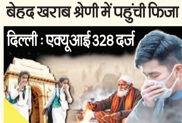
दिल्ली: एक्वुआई 328 दर्ज