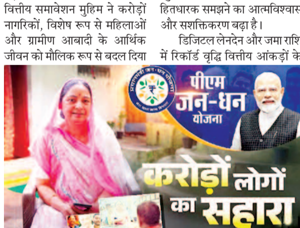
पीएम जन-धन योजना करोड़ों लोगों का सहारा