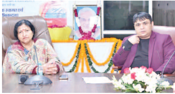
गाजियाबाद नगर निगम मुख्यालय में पार्षद व अधिकारी जुड़े