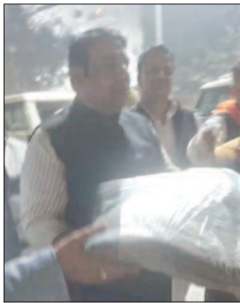
को सुध ली है जो उसके वोट नहीं है। राजनीति में कई बार ये आरोप भी लग जाता है कि वोट बैंक के लिए काम हो रहा है।

गाजियाबाद, करंट क्राइम। कड़कें की ठंड शुरू हो गई है और ऐसे में उनके लिए जीवन एक बड़ी चुनौती बनता है जिनके सर पर छत नहीं है। जिनके पास सर्दी से बचने के लिए गर्म कपड़े नहीं हैं। सड़क किनारे कूड़ा जलाकर उससे ठंड दूर करना उनके लिए एक उपाय होता है। कई ऐसे भी हैं जो सिर्फ सामान्य कपड़ों में खुद को ठंड से बचाने के लिए संघर्ष करते हैं। सर्दी की मार है और ऐसे में एक जनप्रतिनिधि ऐसा भी जिसने अपनी विधानसभा में रहने वाले उन गरीबों