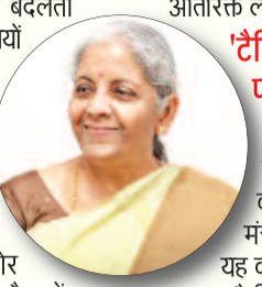
'टैरिफ किंग' के तममे पर करारा जवाब भारत पर अक्सर लगाए जाने वाले आरोपों का जवाब देते हुए वित्त मंत्री ने कहा, भारत को जा देकर कहा कि इस माहौल में भारत को बहुत सावधानी से अपना रास्ता तय करना होगा, और देश की समग्र आर्थिक मजबूती उसे एक अतिरिक्त लाभ प्रदान करेगी।

नई दिल्ली। वित्त मंत्री निर्मला सीतारमण ने कहा कि वैश्विक व्यापार में टैरिफ का हथियार की तरह इस्तेमाल हो रहा है।