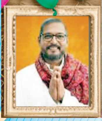
नाना पाटेकर अभिनेता