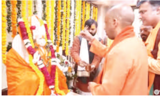
प्रयागराज। उत्तर प्रदेश के मुख्यमंत्री योगी आदित्यनाथ ने शनिवार को संगम नगरी प्रयागराज का दौरा किया। इस दौरान उन्होंने संगम पर गंगा पूजन कर प्रदेश की खुशहाली की कामना की और आगामी माघ मेले की तैयारियों का गहनता से जायजा लिया।

माघ मेला इस बार 800 हेक्टेयर में बसाया जाएगा। मेला क्षेत्र का विस्तार किया जा रहा है जो अरेल से लेकर हटा पट्टी तक होगा।