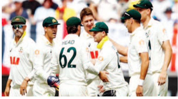
ऑस्ट्रेलिया और इंग्लैंड के बीच जारी एशेज सीरीज का पहला मुकाबला दो दिन में समाप्त हो गया। इस पर ऑस्ट्रेलियाई मीडिया और प्रशंसकों की चुप्पी से उनका दोहरा चरित्र उजागर हो चुका है।

पर्थ। ऑस्ट्रेलिया और इंग्लैंड के बीच जारी प्रतिष्ठित एशेज टेस्ट सीरीज का पहला मुकाबला शनिवार को खत्म हो गया। पर्थ में खेले गए इस मैच को ऑस्ट्रेलिया ने आठ विकेट से जीत लिया, लेकिन प्रशंसक इस बात से हैरान हैं कि इस मुकाबले का नतीजा दो दिन में ही निकल आया। बड़ी बात यह है कि इस पर ऑस्ट्रेलियाई मीडिया की तरफ से कोई टिप्पणी नहीं की गई है। इससे पहले जब भारत और दक्षिण अफ्रीका के बीच खेले गए कोलकाता टेस्ट के दौरान जब दूसरे दिन 15 विकेट गिरे थे, तब इन्होंने की तरफ से 'फ्रंट टेस्ट क्रिकेट' कहा गया था।