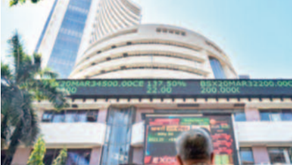
अपने वर्ष के उच्चतम स्तर को छूने में मदद मिली।

नई दिल्ली। हफ्ते के चौथे कारोबारी दिन यानी गुरुवार को शेयर बाजार हरे निशान पर बंद हुआ। 30 शेयरों वाला बीएसई सेंसेक्स 446.21 अंक उछलकर 85,632.68 अंक पर बंद हुआ। वहीं, 50 शेयरों वाला एनएसई निफ्टी 139.50 अंक की बढ़त के साथ 26,192.15 पर बंद हुआ। तेल और गैस व चुनिंदा वित्तीय संस्थागत निवेशकों (एफआईआई) ने लिवाली तथा ताजा विदेशी पूंजी प्रवाह के चलते लगातार दूसरे दिन बढ़त के साथ बेंचमार्क सेंसेक्स गुरुवार को 446 अंक चढ़ गया। 30 शेयरों वाला बीएसई सेंसेक्स 446.21 अंक या 0.52 प्रतिशत चढ़कर 85,632.68 पर बंद हुआ। कारोबार के दौरान यह 615.23 अंक या 0.72 प्रतिशत की बढ़त के साथ 52 सप्ताह के उच्चतम स्तर 85,801.70 अंक पर पहुंच गया। वहीं 50 शेयरों वाला निफ्टी 139.50 अंक या 0.54 प्रतिशत बढ़कर 26,192.15 पर बंद हुआ। अमेरिकी डॉलर के मुकाबले रुपया 23 पैसे गिरकर 88.71 (अंतिम) पर बंद हुआ। विशेषकों ने कहा कि वैश्विक समकक्षों के शेयरों में तेजी से सूचकांकों को दिन के दौरान 0.54 प्रतिशत बढ़कर 26,192.15 पर बंद हुआ। अमेरिकी डॉलर के मुकाबले रुपया 23 पैसे गिरकर 88.71 (अंतिम) पर बंद हुआ। विशेषकों ने कहा कि वैश्विक समकक्षों के शेयरों में तेजी से सूचकांकों को दिन के दौरान 0.54 प्रतिशत बढ़कर 26,192.15 पर बंद हुआ।