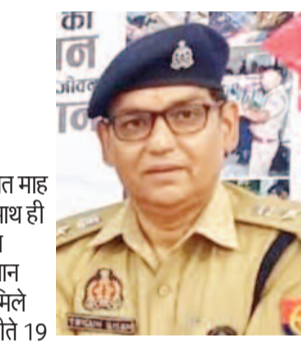
गाजियाबाद, करंट क्राइम : पुलिस कमिश्नरट गाजियाबाद वाले सिस्टम