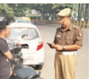
गाजियाबाद, करंट क्राइम : पुलिस कमिश्नरट गाजियाबाद वाले सिस्टम

करंट क्राइम : पुलिस कमिश्नरट गाजियाबाद के सुत्रों से मिली जानकारी के अनुसार यातायात पुलिस द्वारा 23,200 दोपहिया वाहन चालकों के खिलाफ कार्रवाई की गई है। जिसमें 10,000 से अधिक ऐसे दोपहिया वाहन चालक हैं, जिन्होंने हेलमेट नहीं पहना हुआ था। साथ ही 7000 से ज्यादा ऐसे लोग हैं, जो दोपहिया वाहनों पर ट्रिपलिंग कर रहे थे। इसके साथ ही गलत दिशा और जाति सूचक नंबर प्लेट का इस्तेमाल करने पर भी कार्रवाई की गई है। वहीं गलत दिशा में आने वाले वाहन चालकों पर भी ट्रैफिक पुलिस ने चालान वाली कार्रवाई की है।