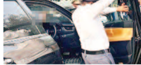
गाजियाबाद, करंट क्राइम : पुलिस कमिश्नरट गाजियाबाद वाले सिस्टम

करंट क्राइम : गाजियाबाद यातायात पुलिस द्वारा यातायात माह का आयोजन किया जा रहा है। जिसके तहत डीसीपी ट्रैफिक निगुण बिसैन ने जानकारी दी है कि अब तक 5000 से ज्यादा थार और फॉर्च्यूनर गाड़ी वालों के चालान किए गए हैं। जिन्होंने या तो काली फिल्म का इस्तेमाल किया था, या उनपर जाति सूचक शब्द लिखे हुए थे। इसके साथ ही राजनीतिक दलों के पोस्टर लगाने वालों पर भी पुलिस ने कार्रवाई की है। वहीं फेसी नंबर प्लेट के साथ ही गाड़ी में हूटर और फेसी लाइटिंग करने वालों को भी बर्खा नहीं गया है।