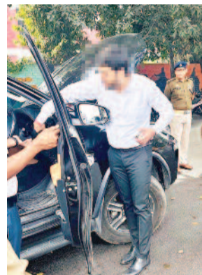
गाजियाबाद, करंट क्राइम : पुलिस कमिश्नरट गाजियाबाद वाले सिस्टम

- थार से लेकर काली फिल्म वालों का हुआ है ईलाज