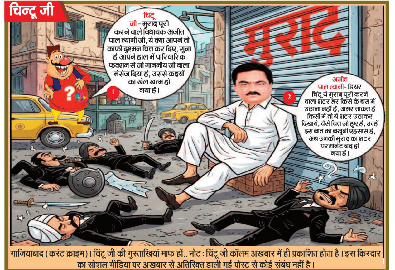
गाजियाबाद (करंट क्राइम)। चिट्ठू जी की गुस्ताखियां माफ हों... नोट: चिट्ठू जी कॉलम अखबार में ही प्रकाशित होता है। इस किरदार का सोशल मीडिया पर अखबार से अतिरिक्त डाली गई पोस्ट से कोई संबंध नहीं है।