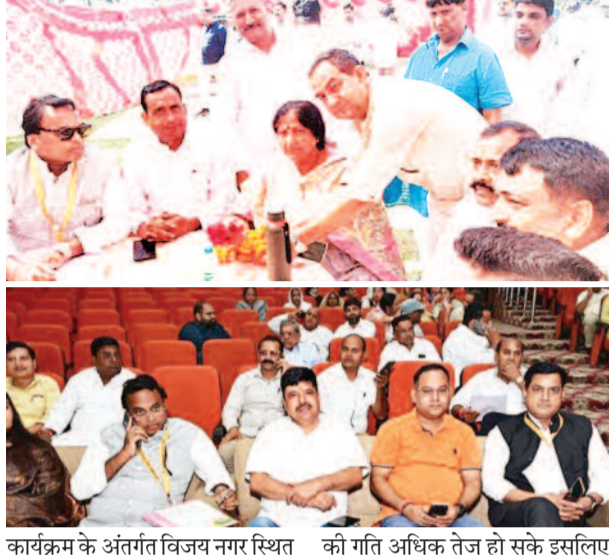
कार्यक्रम के अंतर्गत विजय नगर स्थित मिलिट्री ग्राउंड पर बने उपवन का नाम नमो उपवन रखने के प्रस्ताव को भी पारित किया गया। इसके साथ सभी वाडों में विकास