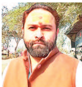
एक आध्यात्मिक यात्रा का प्रतीक है जो भक्त को आत्म-ज्ञान और आंतरिक परिवर्तन की ओर ले जाती है। यह पर्व प्रकृति के साथ चेतना को जुड़ाव का उत्सव है, जहां तीन मूल गुणों-तमस (जड़ता), रजस (क्रियाशीलता), और सत्व (पवित्रता)-के अनुसार देवी की पूजा की जाती है। नवरात्रि के अंत में विजयदशमी पर काम, क्रोध, मद, लोभ जैसी आंतरिक राक्षसी प्रवृत्तियों को खत्म कर विजय का उत्सव मनाया जाता है। पंडित ने बताया कि नवरात्रि यानी दिव्य नौ रातें, गहरे विश्राम और शरीर तथा मन को फिर से ऊर्जावान बनाने का सबसे अच्छा समय होता है। इसमें प्रत्येक दिन देवी माँ के नौ रूपों में से एक रूप को समर्पित किया जाता है।