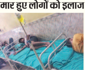
कुटूटा का आटा खाने से बीमार हुए लोगों को इलाज के बाद घर भेजा गया।