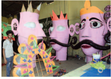
गौरव शशि नारायण