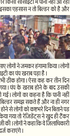
करोड़ों खर्च कर घर खरीदा लेकिन तीन दिन से पानी नहीं मिला यह है आदित्य मेगा सिटी का हाल, रजिडेंट्स उतरे सड़कों पर

गाजियाबाद। करंट क्राइम। तीन दिन से अगर किसी सोसाइटी में पानी नहीं आ रहा हो तो वहां रहने वालों का क्या हाल होगा, इसका एहसास न तो बिल्डर को है और न ही नगर निगम को। जी हाँ, वेब सिटी के आदित्य वर्ल्ड सिटी में पिछले तीन दिनों से पानी नहीं आ रहा है। जबकि यहां के करोड़ों खर्च कर अपना आशियाना लिया है। पानी नहीं आने से गुरुत्वाकर्षण ने जमकर हंगामा किया। लोगों का कहना है कि पिछले तीनों दिनों से सोसाइटी का पंप खराब पड़ा है। शिकायत करने पर कहा जा रहा है कि अभी ठीक होगा। ऐसा कह कर तीन दिन बीत गए लेकिन पंप को ठीक नहीं किया गया। पंप के खराब होने के बाद उसकी जगह पर वैकल्पिक व्यवस्था तक नहीं की गई। लोगों का कहना है कि पानी नहीं होने से दिनरात कैसे कटती है, इसे ना तो बिल्डर समझ सकते हैं और ना ही नगर निगम या सरकार की एजेंसियां। पानी नहीं होने से लोगों को कष्टभरे दिन बिताने पड़ रहे हैं। जब बिल्डर की ओर से कुछ नहीं किया गया तो रजिडेंट्स ने खुद ही टैंकर मंगाया। बिल्डर के खिलाफ जमकर नारेबाजी की। लोगों ने कहा कि वे जिलाधिकारी से मिलकर बिल्डर के खिलाफ शिकायत दर्ज कराएंगे।