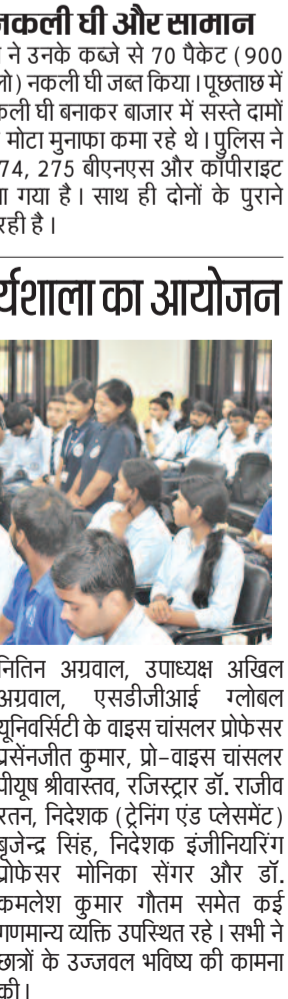
एक हिस्सा है। यह एक ऐसा तरीका है जिससे सिस्टम बिना किसी स्पष्ट प्रोग्रामिंग के डेटा से सीख सकते हैं। उन्होंने जोर देकर कहा कि ये तकनीकें छात्रों के लिए बहुत महत्वपूर्ण हैं। ये उनकी समस्या-समाधान क्षमता को बढ़ाती हैं, नवाचार को बढ़ावा देती हैं और उन्हें भविष्य के रोजगार के लिए तैयार करती हैं। छात्र एआई और एमएल का उपयोग करके अपनी विश्लेषणात्मक क्षमताओं को बढ़ा सकते हैं। इसके अलावा, वे

करंट क्राइम। छापेमारी के दौरान पुलिस ने उनके कब्जे से 70 पैकेट (900 एमएल वाले) और 5 ड्रम (कुल 133 किलो) नकली घी जब्त किया। पछताख में सामने आया कि आरोपी लंबे समय से नकली घी बनाकर बाजार में सस्ते दामों पर बेच रहे थे और लोगों को गुमराह कर मोटा मुनाफा कमा रहे थे। पुलिस ने बताया कि आरोपियों के खिलाफ धारा 274, 275 बीएनएस और कोपीराइट एक्ट की धाराओं में मुकदमा दर्ज किया गया है। साथ ही दोनों के पुराने आपराधिक इतिहास की भी जांच की जा रही है।