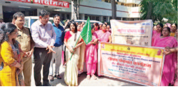
अग्रवाल ने की। पंचायत की शुरुआत एक पेड़ माँ के नाम अभियान के तहत पौधापोषण से हुई। बच्चों ने नुकड़ नाटक के माध्यम से फास्ट फूड बनाम हेल्दी फूड का प्रभावी संदेश दिया। इसी क्रम में स्वदेशी खिलौना प्रदर्शनी