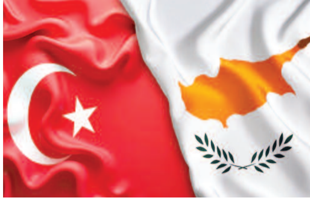
साइप्रस की सुरक्षा

अंकारा। तुर्किये ने चेतावनी दी है कि साइप्रस को तरफ से इस्त्राइल से एयर डिफेंस सिस्टम खरीदने का कदम द्वीप पर शांति और स्थिरता को खतरे में डाल सकता है। तुर्किये रक्षा मंत्रालय के अधिकारियों ने कहा कि यह कदम द्वीप पर मौजूद नाजुक संतुलन को बिगाड़ सकता है और 'खतरनाक परिणाम' सामने ला सकता है। सुत्रों के मुताबिक, साइप्रस को हाल ही में इस्त्राइल निर्मित बराक एमएक्सएस इंटीग्रेटेड एयर डिफेंस सिस्टम की आपूर्ति की गई है। यह आधुनिक सिस्टम 150 किलोमीटर की दूरी से दुश्मन के मिसाइल, ड्रोन और विमान को एक साथ इंटरसेप्ट करने की क्षमता रखता है। इससे साइप्रस की सुरक्षा क्षमता में बड़ी बढ़ोतरी होगी। पुराने सोवियत हथियार के सहारे