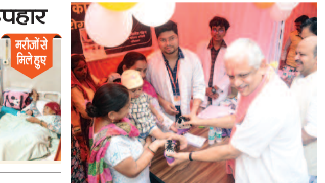
मरीजों से मिलते हुए

करंट क्राइम। कार्यक्रम के दौरान अस्पताल में जन्मे प्रत्येक शिशु को 500 रुपए और उनकी माताओं को भी 500 रुपए नगद उपहार दिए गए। इसके साथ ही सभी माताओं को बेबी किट और डायपर का पैकेट भेंट किया गया। अस्पताल में भर्ती मरीजों को भी फल वितरित किए गए।