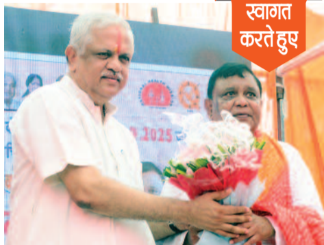
स्वागत करते हुए