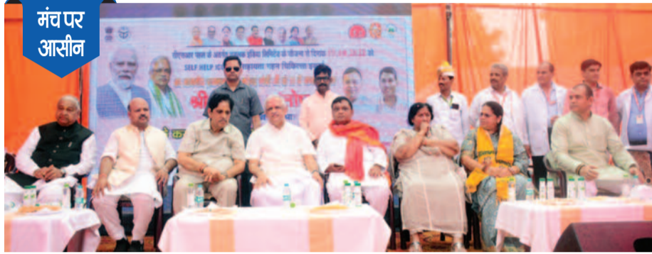
मंच पर आसीन