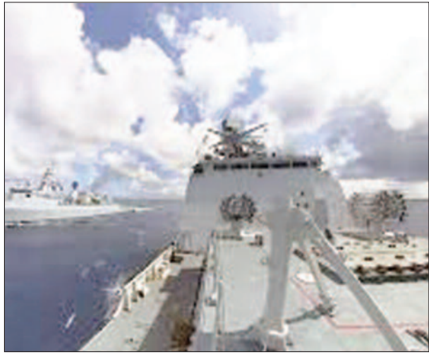
चीन के कोस्ट गार्ड ने दावा किया कि फिलीपींस की 10 से अधिक सरकारी नावें अलग-अलग दिशाओं से स्कारबोरो शोल के पास पहुंचीं। इस दौरान चीनी जहाजों ने उन्हें रोकने के लिए वाटर कैनन का इस्तेमाल किया। चीन इस क्षेत्र को हॉन्गकॉन्ग द्वीप कहता है और इस पर अपना दावा जताता है।

बीजिंग । दक्षिण चीन सागर में विवादित स्कारबोरो शोल के पास मंगलवार को चीन और फिलीपींस के चीन ने लगाया आरोपजहाजों के बीच टकराव हो गई। चीन के कोस्ट गार्ड ने आरोप लगाया कि फिलीपींस की एक सरकारी नाव ने जानबूझकर उनकी नौका को टक्कर मारी। यह घटना ऐसे समय हुई है जब दोनों देशों के बीच इस क्षेत्र पर दावे को लेकर पहले से ही तनाव चल रहा है।