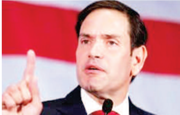
तो निर्वासन के लिए तैयार हो जाइए। इस देश में आपका स्वागत नहीं है। अमेरिकी सुरक्षा विभाग (डीएचएस) की सहायक सचिव टिशा मैकलॉफ्लिन ने भी कहा कि ऐसे लोगों के वीजा रद्द किए जाने चाहिए जो अमेरिकी नागरिकों की हत्या को महिमामंडित करते हैं। इससे पहले, अमेरिका के उप विदेश सचिव क्रिस्टोफर लैंडॉउ ने भी एक्स पर लिखा, मैं यह स्पष्ट करना चाहता हूँ कि जो विदेशी नागरिक हिंसा और नफरत को बढ़ावा देते हैं, वे हमारे देश में स्वागत योग्य नहीं हैं। सोशल मीडिया पर कुछ लोगों को इस घटना का

अमेरिका । अमेरिका के विदेश मंत्री मार्को रूबियो ने कहा कि ऐसे विदेशी नागरिकों के वीजा रद्द किए जा रहे हैं, जो दक्षिणपंथी टिप्पणीकार चार्ली किर्क की हत्या पर जश्न मना रहे हैं। उन्होंने कहा कि अमेरिका उन विदेशियों को अपने देश में नहीं रखेगा जो हमारे नागरिकों की मौत का जश्न मनाते हैं। फॉक्स न्यूज से बातचीत में रूबियो ने कहा कि अमेरिका को ऐसे लोगों को देश में घुसने या रहने की अनुमति नहीं मिलनी चाहिए, जो इस तरह की हत्याओं का समर्थन करते हैं या उनका जश्न मनाते हैं। उन्होंने कहा, हमें ऐसे लोगों को वीजा नहीं देना चाहिए जो अमेरिका आकर किसी राजनीतिक व्यक्ति की हत्या, फांसी या हत्या जैसी घटनाओं का जश्न मनाएं और अगर वो पहले से यहाँ हैं, तो उनका वीजा रद्द कर देना चाहिए। रूबियो ने एक्स पर अपने बयान का वीडियो साझा किया और लिखा, जो लोग हमारे नागरिकों की मौत का जश्न मना रहे हैं, उन्हें अमेरिका में जगह नहीं मिलेगी। वीजा रद्द किए जा रहे हैं। अगर आप वीजा पर यहाँ हैं और किसी राजनीतिक व्यक्ति की सार्वजनिक हत्या पर खुश हो रहे हैं,