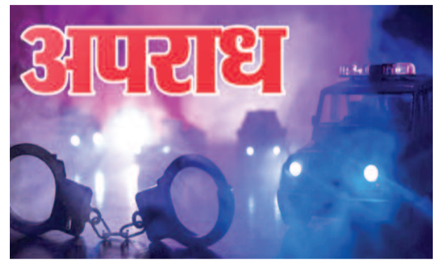
ने कहा कि ट्रंप प्रशासन और गृह सुरक्षा सचिव क्रिस्टी नोएम अब ऐसे अपराधियों को अमेरिका में रहने की अनुमति नहीं देते। अगर कोई अवैध रूप से अमेरिका आता है तो उसे एस्वातिनी, गुआंटा, दक्षिण सूडान जैसे देशों में भेजा जा सकता है। ट्रंप ने दी थी प्रतिक्रिया हालांकि इससे पहले हत्या के मामले में अमेरिका के राष्ट्रपति डोनाल्ड ट्रंप ने