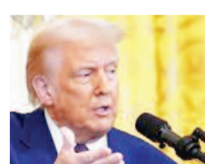
(गृह ऋण में घोखाघड़ी) का आरोप लगा था। ये आरोप फेडरल हाउसिंग फाइनेंस एजेंसी के डायरेक्टर बिल पुल्टे ने लगाए, जो ट्रंप के कट्टर समर्थक और फेडरल रिजर्व के चेयरमैन जेरोम पावेल के आलोचक माने जाते हैं। बिल पुल्टे का आरोप है कि जून 2021 में लिसा कुक ने मिशिंगन में एक प्रॉपर्टी खरीदी थी और 15 साल के मॉर्गन एप्रोमेंट में इसे अपना प्रिंसिपल रेजिडेंस यानी मुख्य घर बताया था। इसके एक महीने बाद जुलाई 2021 में कुक ने जॉर्जिया के अटलांटा में एक और प्रॉपर्टी खरीदी

अमेरिका । अमेरिका की एक अपील अदालत ने राष्ट्रपति ट्रंप को झटका देते हुए उनके एक आदेश पर रोक लगा दी है। दरअसल ट्रंप ने फेडरल रिजर्व की गवर्नर लिसा कुक को पद से हटाने का आदेश दिया था, जिसे अब अपील अदालत ने खारिज कर दिया है। अमेरिका में ब्याज दरों को लेकर महत्वपूर्ण बैठक होनी है, उससे पहले लिसा कुक की पद पर बहाली ट्रंप के लिए परेशानी खड़ी कर सकती है। लिसा कुक को पद से हटाने के लिए अब ट्रंप प्रशासन सुप्रीम कोर्ट का रुख कर सकता है।