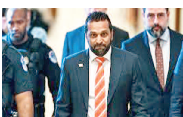
अमेरिकी में बढ़ती राजनीतिक हिंसा के बीच वह पद के लिए सही व्यक्ति हैं। पटेल का अब तक का विवादों भरा कार्यकाल पटेल इससे पहले जनवरी में समिति के समक्ष पेश हुए थे, जिसमें उन्होंने डेमोक्रेटिक पार्टी के सांसदों को आश्वासन दिया था कि वह निदेशक के रूप में किसी भी तरह की राजनीतिक बदले की कार्रवाई नहीं करेंगे। अब उन्होंने पूछा जाएगा कि क्या उन्होंने ऐसा किया है। एफबीआई ने पिछले महीने पांच एजेंटों और वरिष्ठ अधिकारियों को बर्खास्त किया है। मौजूदा व पूर्व

वॉशिंगटन । संघीय जांच ब्यूरो (एफबीआई) के निदेशक काश पटेल को सीनेट की एक समिति की पूछताछ का सामना करना पड़ेगा। डेमोक्रेटिक पार्टी के सांसद उनसे चार्ली किर्क की हत्या की जांच और एफबीआई के अंदर वरिष्ठ अधिकारियों को हटाए जाने को लेकर कड़े सवाल पूछ सकते हैं। इन अधिकारियों ने एफबीआई निदेशक पर राजनीतिक बदले की कार्रवाई करने का आरोप लगाया है। सीनेट की न्यायपालिका समिति उनसे पूछताछ करेगी। एफबीआई प्रमुख के पद पटेल को अभी बहुत ज्यादा समय नहीं हुआ है, लेकिन उनका कार्यकाल विवादों भरा रहा है। समिति के सामने पटेल को साबित करना होगा कि एफबीआई के अंदरूनी उथल-पुथल और