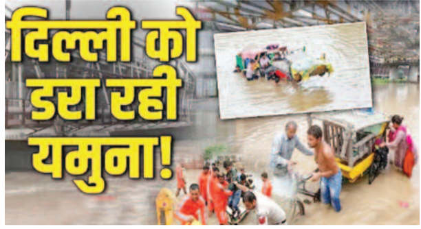
दिल्ली को डरा रही यमुना!