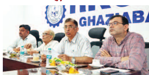
रु. 1,10,000 की पुरस्कार राशि पहले से चोथे पोजीशन तक प्रदान की जाएगी।