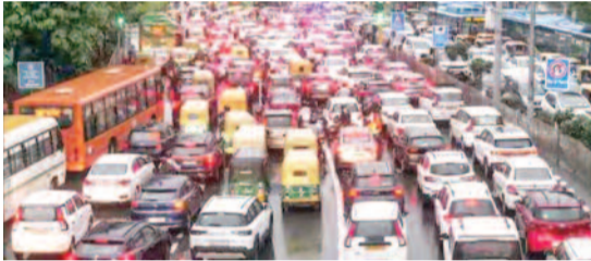
जिसके कारण एयरलाइनों को यात्रा संबंधी अंडरपास ओखला, पुल प्रह्लादपुर अंडरपास, एयरपोर्ट, मूलचंद आदि अंडरपास में दिन भर जलभराव की स्थिति रही। इससे वाहनों की आवाजाही में दिन भर परेशानी होती रही। इससे जाम जैसे हालात पैदा हो गए थे। इसके अलावा प्रमुख मार्गों पर भी जलभराव होने से जगह-जगह जाम लग रहा था। इनमें धौला कुआ, एनएच-8 व 24, महिपालपुर, अंधेरिया मोड़, सतबड़ी-महरोली रोड, पूरा एम्बी रोड, ग्रीन पार्क, मॉडल टाउन, लक्ष्मी नगर, सीलमपुर, जाफराबाद, गार्जीपुर, शाहदा आदि जगहों पर जाम की स्थिति बनी रही।