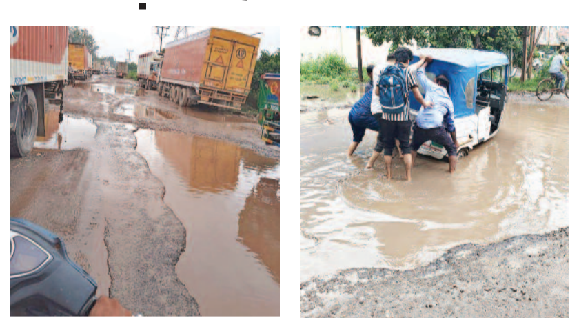
सड़कों के निर्माण का प्रस्ताव तैयार किया है, जिस पर लगभग 21 करोड़ रुपये खर्च होने का अनुमान है। हालांकि, विभाग ने साफ कर दिया है कि यह काम मौनसून के बाद ही शुरू किया जाएगा, क्योंकि बारिश के मौसम में सड़क निर्माण कार्य करना संभव नहीं होता। इस परिणाम से लोगों को राहत मिलने के साथ-साथ औद्योगिक क्षेत्र की स्थिति में भी सुधार होने की उम्मीद है।

साहिबाबाद (करंट क्राइम)। गाजियाबाद के साहिबाबाद औद्योगिक क्षेत्र साइट-4 में सड़कों की बहाली एक गंभीर समस्या बन गई है। सड़कों पर गहरे गड्ढों के कारण आए दिन हादसे हो रहे हैं, जिससे न केवल वाहन चालकों को परेशानी हो रही है, बल्कि उद्योगों का काम भी प्रभावित हो रहा है। स्थानीय लोगों का आरोप है कि विभाग की लापरवाही के चलते सड़कों की मरम्मत नहीं हो रही है। उद्योगों और लोगों पर पड़ रहा है सीधा असर : टूटी और गड्ढों से भरी सड़कों के कारण कच्चा माल लाने और तैयार माल बाहर भेजने में भारी मुश्किलें आ रही हैं, जिससे औद्योगिक उत्पादन प्रभावित हो रहा है। इसके अलावा, इन सड़कों से उड़ने वाली धूल प्रदूषण को भी बढ़ा रही है, जो स्वास्थ्य के लिए एक बड़ा खतरा है। मौनसून के बाद शुरू होगा निर्माण कार्य : इस समस्या के समाधान के लिए यूपीसीडी (वडउकम्ह) ने पहल की है। विभाग ने साइट-4 में 15 प्रमुख