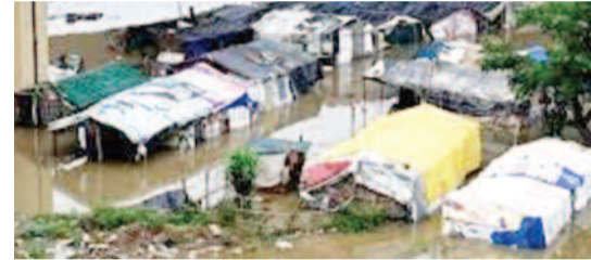
लगातार तीसरे साल सितंबर दूसरे दिन रहा ठंडा: दिल्ली-एनसीआर में सोमवार शाम से लेकर रात भर मूसलाधार बारिश हुई। ऐसे में लगातार तीसरे साल भी सितंबर दूसरे दिन ठंडा रहा। बीते तीन साल से न्यूनतम तापमान 21 डिग्री सेल्सियस के करीब रहा है। दूसरी ओर, मानसून का असर मंगलवार को भी देखने को मिला।