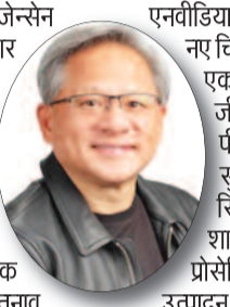
एनवीडिया ताइवान की चिप निर्माता के साथ छह नए चिप्स पर सहयोग कर रही है। इनमें एक ग्राफिक्स प्रोसेसिंग यूनिट (जीपीयू) और एनवीडिया के अगली पीढ़ी के रुबिन-आर्किटेक्चर सुपरकंप्यूटर्स के लिए एक सिलिकॉन फोटोनिक्स प्रोसेसर शामिल है। साथ ही एक सेंट्रल प्रोसेसिंग यूनिट (सीपीयू) और सिक् उत्पादन के लिए डिजाइन किए गए एनवीलिक चिप्स भी शामिल हैं। रिपोर्ट में

टीएसएमसी के साथ चिप निर्माण के लिए नई साझेदारी पर चर्चा नई दिल्ली। एनवीडिया प्रमुख जेन्सेन हुआंग ने इस साल तीसरी बार ताइवान के दौर पर हैं। उन्होंने वहां ताइवैन सेमीकंडक्टर मैन्युफैक्चरिंग कंपनी (टीएसएमसी) के अधिकारियों से मुलाकात की। यह दौरा उस समय हुआ जब अमेरिका और चीन के बीच अक उत्पन्न के लिए डिजाइन किए गए बड़ा हुआ है। हुआंग का यह दौरा क्यों है अहम एनवीलिक चिप्स भी शामिल हैं। रिपोर्ट में बताया गया है 1.17 अरब डॉलर और दूसरी तिमाही में 1.06 अरब डॉलर की सहायता प्राप्त हुई। 2024 में प्राप्त 2.49 अरब डॉलर को मिलाकर, कंपनी ने पिछले 18 महीनों में चारों सरकारों से 4.7 अरब की सहायता प्राप्त की है। एरिजोना में टीएसएमसी के तीन उन्नत सेमीकंडक्टर संयंत्रों का हो रहा विस्तार अमेरिका में, ढरठ की एरिजोना स्थित सहायक कंपनी 65 अरब डॉलर मूल्य के तीन उन्नत सेमीकंडक्टर संयंत्रों के साथ तेजी से विस्तार कर रही है।