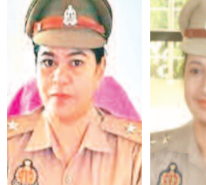
गाजियाबाद, करंट क्राइम : पुलिस कमिश्नरेट गाजियाबाद वाले सिस्टम

इंदिरापुरम, वेव सिटी, घंटाघर कोतवाली, मसूरी और मुरादनगर पहुंचे बॉटम पांच में