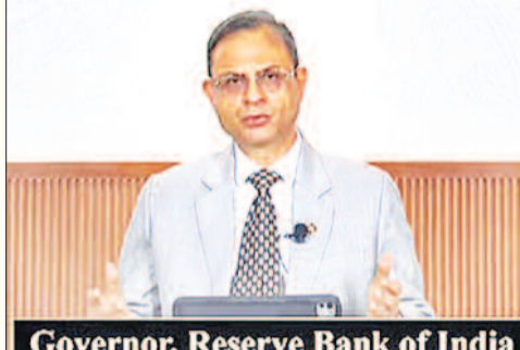
Governor, Reserve Bank of India

बदलेगा, हालांकि यह देखा दिलचस्प होगा कि आरबीआई इस आंकड़े को कैसे देखता है। वर्ष के लिए मुद्रास्फीति के अनुमान में 0.1-0.2 प्रतिशत की मामूली कमी हो सकती है, यानी 3.7 प्रतिशत के बजाय 3.5-3.6 प्रतिशत। हालांकि, वर्तमान संदर्भ में, अर्थव्यवस्था के लिए तेल की लागत भी एक विचारणीय बात होगी। उन्होंने कहा, इसलिए, इस बार हमें रुख या नीतिगत दर में किसी बदलाव की उम्मीद नहीं है। लचीले विकास के मोर्चे पर कुछ राहत मिलने के साथ ही रुख अधिक सतर्क रहेगा। केयरएज रेटिंग्स ने आगे कहा कि पिछली दरों में कटौती का अधूरा लाभ लोगों तक पहुंचाने के मद्देनजर, आरबीआई द्वारा आगे और कटौती नहीं करने की उम्मीद है, ताकि पहले के उपायों का पूरा प्रभाव दिखने के लिए समय मिल सके। उपभोक्ता मूल्य सूचकांक (सीपीआई) आधारित खुदरा मुद्रास्फीति फरवरी से 4 प्रतिशत से नीचे बनी हुई है। जून में यह 2.1 प्रतिशत थी।