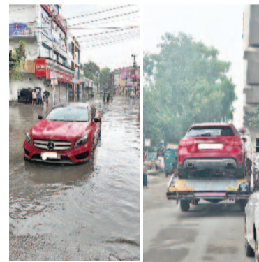
जलस्तर लगातार बढ़ रहा था और जल का प्रवेश इंजन व इलेक्ट्रॉनिक सिस्टम में हुआ, जिसकी पुष्टि ऑथोराइज्ड सर्विस सेंटर द्वारा

गाजियाबाद, करंट क्राइम। नगर निगम द्वारा मेरी शिकायत को 'पेशेवर शिकायतकर्ता' बताकर व्यक्तिगत हमला करना न केवल दुर्भाग्यपूर्ण है, बल्कि यह इस बात का प्रमाण है कि जब कोई नागरिक वास्तविक मुद्दे उठाता है, तो संस्थाएं जवाबदेही के बजाय उसे बदनाम करने का प्रयास करती हैं।