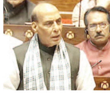
बिना आतंकी शिबिरों को नष्ट करने का विकल्प चुना।

के लिए सुरक्षा बलों की सराहना करता हूँ। रक्षा मंत्री राजनाथ सिंह ने लोकसभा की तरह राज्यसभा में भी चर्चा शुरू की। उन्होंने कहा कि हमारी सेनाओं ने पाकिस्तान में नागरिकों की जान को कोई नुकसान पहुंचाए