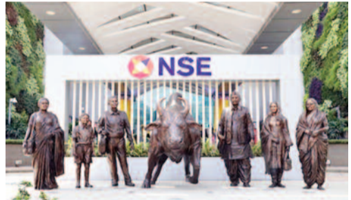
आईसीआईसीआई बैंक, एचडीएफसी बैंक और फिलार्स इंडस्ट्रीज प्रमुख लाभ में रहीं। वहीं हिंदुस्तान यूनिवर्सल, अल्ट्राटेक सीमेंट, भारत इलेक्ट्रॉनिक्स और आईटीसी पिछड़ने वालों में शामिल रहे।

नई दिल्ली। पिछले दिन की गिरावट के बाद बुधवार को शेयर बाजार हरे निशान पर बंद हुआ। 30 शेयरों वाला बीएसई सेंसेक्स 539.83 अंक उछलकर 82,726.64 अंक पर बंद हुआ। वहीं, 50 शेयरों वाला एनएसई निफ्टी 159 अंक की बढ़त के साथ 25,219.90 पर बंद हुआ। जपान-अमेरिका के व्यापार समझौता होने बाद एशियाई बाजारों में सकारात्मक रुख देखने को मिला। हफ्ते के तीसरे कारोबारी दिन बीएसई सेंसेक्स में करीब 540 अंक की बढ़त दर्ज की गई। 30 शेयरों वाला बीएसई सेंसेक्स 539.83 अंक या 0.66 प्रतिशत उछलकर 82,726.64 अंक पर बंद हुआ। कारोबार के दौरान यह 599.62 अंक या 0.72 प्रतिशत बढ़कर 82,786.43 अंक पर पहुंच गया। वहीं 50 शेयरों वाला एनएसई निफ्टी 159 अंक या 0.63 प्रतिशत की बढ़त के साथ 25,219.90 पर आ गया। अमेरिकी डॉलर के मुकाबले रुपया 5 पैसे गिरकर 86.43 (अर्नातिम) पर बंद हुआ। सेंसेक्स की कंपनियों का हाल सेंसेक्स की कंपनियों में टाटा मोटर्स, भारतीय एयरटेल, बजाज फाइनेंस, मारुति, बजाज फिनसर्व,