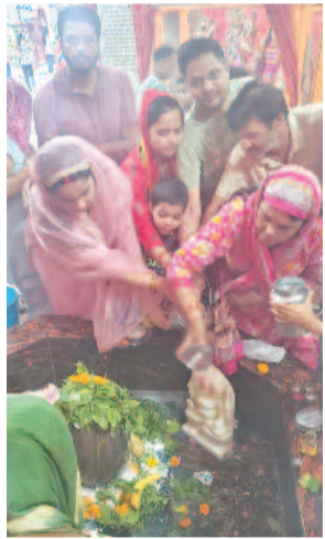
मनोकामना पूर्ण होती है। कांडावइ इस

गाजियाबाद, करंट क्राइम। श्रावण मास की शिवरात्रि भगवान भोलेनाथ का विशेष दिन होता है, जब भक्तजन उपवास रखते हैं। जलाभिषेक करते हैं और हर-हर महादेव के जयकारों से वातावरण को पवित्र बनाते हैं। यह दिन केवल पूजा का नहीं, बल्कि आत्मशुद्धि, आस्था और भगवान शंकर की कृपा प्राप्ति का दिन है। बुधवार को शिवरात्रि के पावन पर्व पर गोविंदपुरम गाजियाबाद के शिव मंदिर में भक्तों की भारी भीड़ रही। जल चढ़ाने को लेकर महिलाएं और पुरुष हजारों की संख्या में मंदिर में आए। इस मौके पर भक्तों ने भगवान भोलेनाथ का जलाभिषेक किया। सावन के महीने में शिव की पूजा करने से भक्तों की