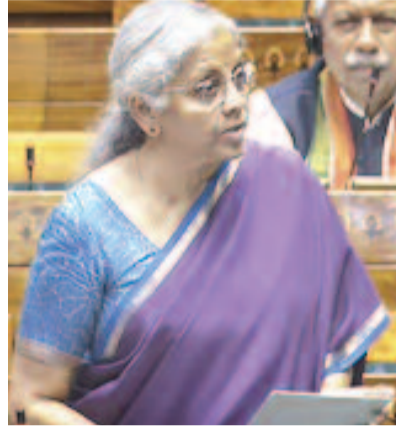
1,26,508 ऋण खातों को स्वीकृति दी गई। इनमें से 86,738 खाते महिला उद्यमियों के थे, जिन्हें 20,521.41 करोड़ के ऋण मिले। एससी वर्ग के 30,145 खातों को 6,437.59 करोड़ और एसटी वर्ग के 9,625 खातों को 2,037.15 करोड़ के ऋण स्वीकृत किए गए।

नई दिल्ली। वित्त मंत्री निर्मला सीतारमण ने बताया कि स्टैंडअप इंडिया योजना के तहत अप्रैल 2022 से मार्च 2025 तक अनुसूचित जाति (रज), अनुसूचित जनजाति और महिला उद्यमियों को लगभग 29,000 करोड़ रुपये के ऋण मंजूर किए गए हैं। केंद्र सरकार की स्टैंडअप इंडिया योजना के तहत अप्रैल 2022 से मार्च 2025 तक अनुसूचित जाति, अनुसूचित जनजाति और महिला उद्यमियों को लगभग 29,000 करोड़ रुपये के ऋण मंजूर किए गए हैं। केंद्रीय वित्त मंत्री निर्मला सीतारमण ने मंगलावर को संसद में यह जानकारी दी। सीतारमण ने कहा कि वित्तीय सहायता के अलावा, यह योजना हाशिए पर पड़े वर्गों को मार्गदर्शन, प्रशिक्षण और विशिष्ट विशेषज्ञता प्रदान करती है। इसमें कौशल केंद्र, मेंटशिप सहायता, उद्यमिता विकास कार्यक्रम केंद्र, जिला उद्योग केंद्र शामिल है।