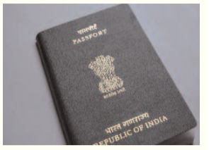
अंतरराष्ट्रीय वायु परिवहन संघ के विशिष्ट आंकड़ों पर आधारित है और यह उन गंतव्यों की संख्या दर्शाती है जहां पासपोर्ट बिना पूर्व वीजा के प्रवेश की अनुमति देता है। एशियाई पड़ोसी देश जापान और दक्षिण कोरिया संयुक्त रूप से दूसरे स्थान पर हैं, जहां प्रत्येक को 190 गंतव्यों तक वीजा-मुक्त पहुंच प्राप्त है।

नई दिल्ली। भारत ने जनवरी 2025 के बाद से अपनी पासपोर्ट रैंकिंग में बड़ा सुधार दर्ज किया है, और 85वें से 77वें स्थान पर पहुंच गया है। भारत की पासपोर्ट रैंकिंग आठ स्थान ऊपर चढ़ गई है। भारत को 59 देशों के लिए वीजा पहुंच प्राप्त हो गया है। हेनले पासपोर्ट इंडेक्स की रैंकिंग में इसकी पुष्टि हुई है। आईएटीए के आंकड़ों पर आधारित है पासपोर्ट रैंकिंग सिंगापूर ने हेनले पासपोर्ट इंडेक्स में शीर्ष स्थान बरकरार रखा है, उसे दुनिया भर के 227 गंतव्यों में से 193 तक वीजा-मुक्त पहुंच प्रदान की गई है। जुलाई 2025 में प्रकाशित यह रैंकिंग