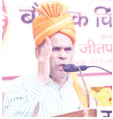
गाजियाबाद, करंट क्राइम : कश्यप निषाद संगठन की ओर से लोनी के गुरुद्वारा रोड इंदिरापुरम स्थित भागवती पैलेस में रविवार को बौद्धिक चिंतन शिविर का आयोजन किया गया। जिसमें मुख्य अतिथि के रूप में उत्तर प्रदेश सरकार के स्वतंत्र प्रभार राज्य मंत्री एवं

बौद्धिक चिंतन शिविर में बुजुर्गों से कहा, युवाओं को दें संस्कार और संगठित रहने का संदेश