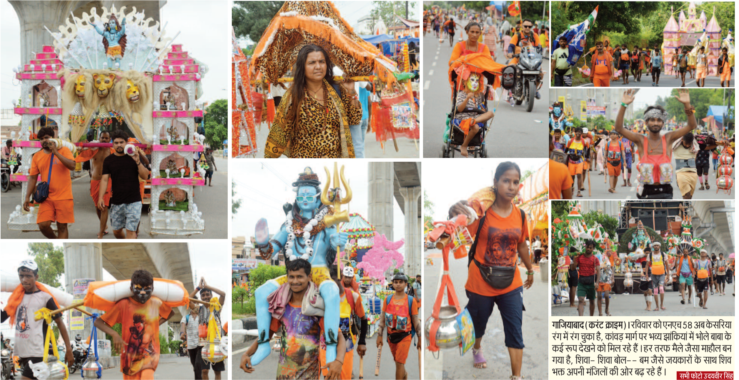
गाजियाबाद (करंट क्राइम)। रविवार को एनएच 58 अब केसरिया रंग में रंग चुका है, कांवड़ मार्ग पर भव्य झांकियों में भोले बाबा के कई रूप देखने को मिल रहे हैं। हर तरफ मेले जैसा माहौल बन गया है, शिवा- शिवा बोल- - बम जैसे जयकारों के साथ शिव भक्त अपनी मजिलों की ओर बढ़ रहे हैं।