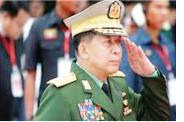
27 साल की जेल सजा काट रही हैं। उनके खिलाफ जिन मामलों में सजा दी गई है, उन्हें व्यापक रूप से राजनीति से बाहर रखने की चाल माना जा रहा है। सू की की अनुपस्थिति ने एक बार फिर उनके

नेपिड़ॉ। यह पहली बार है जब सेना प्रमुख ने 2021 की तख्तापलट के बाद इस कार्यक्रम में भाग लिया। 69 वर्षीय वरिष्ठ जनरल मिन ऑन्ग लैइंग ने यांगून में स्थित शहीद स्मारक पर आंग सान और उनके साथ मारे गए आठ अन्य नेताओं को श्रद्धांजलि अर्पित की। समारोह में म्यांमार का झंडा झुका हुआ था और सेना परिषद के वरिष्ठ सदस्य व मंत्रीगण भी मौजूद थे। यह कदम ऐसे समय पर आया है जब सेना के कब्जे वाले म्यांमार में जल्द चुनाव कराने की तैयारी की जा रही है। आंग सान सू की को सेना ने फरवरी 2021 में सत्ता से हटाकर गिरफ्तार कर लिया था और अब वह