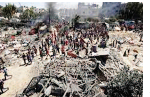
कहना है कि सैकड़ों लोग इन केंद्रों पर गोलीबारी में मारे जा चुके हैं। दो जगहों पर गोलीबारी की वारदात जानकारी के अनुसार, गोलीबारी की घटना मुख्य रूप से दो जगहों पर हुई। जिसमें पहली घटना तेइना इलाका, खान यूनिंस शहर के पास हुई। इस दौरान लगभग तीन किलोमीटर दूर जीएचएफ के एक केंद्र की ओर सैकड़ों लोग पैदल चल रहे थे। गवाहों के अनुसार, पहले इस्राइली सेना ने चेतावनी में हवाई फायरिंग की, लेकिन बाद में सीधे लोगों पर गोलियां बरसा दीं। एक

दीर अल बलाह। जानकारी के मुताबिक, ये सभी फलस्तीनी गाजा मानवतावादी फाउंडेशन (जीएचएफ) नाम की संस्था की तरफ से चलाए जा रहे खाद्य वितरण केंद्रों की ओर जा रहे थे। यह संस्था अमेरिका और इस्राइल की मदद से कई महीने से गाजा में खाना बांट रही है। जीएचएफ ने कई महीने में गाजा में काम शुरू किया था। इसका मकसद भूखे लोगों को खाना पहुंचाना है। अमेरिका और इस्राइल ने इस संस्था को इसलिए समर्थन दिया क्योंकि उनका आरोप है कि पारंपरिक यूएन आधारित राहत वितरण प्रणाली में हमसा के आतंकी राशन चुरा लेते हैं। हालांकि, संयुक्त राष्ट्र इस आरोप को सिरे से खारिज करता है। जीएचएफ दावा करता है कि उसने लाखों खाने के पैकेट बांटे हैं, लेकिन स्थानीय स्वास्थ्य विभाग और प्रत्यक्षदर्शियों का