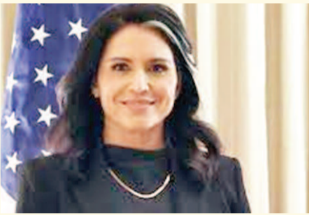
आकलन था कि रूस चुनाव नतीजों को प्रभावित नहीं कर रहा है। यहां तक कि 8 दिसंबर 2016 को राष्ट्रपति की डेली ब्रीफ में कहा गया कि रूस ने अमेरिकी चुनाव के परिणामों को प्रभावित नहीं किया। लेकिन अगले ही दिन ओबामा प्रशासन के निर्देश पर यह आकलन अचानक वापस ले लिया गया और नया खुफिया मूल्यांकन तैयार करने को कहा गया। झूठी जानकारी फैलाने का आरोप गबार्ड ने दावा किया कि ओबामा प्रशासन ने मीडिया में झूठी खबरें फैलाने के लिए जानबूझकर

वॉशिंगटन। तुलसी गबार्ड ने अपने बयान में दावा किया कि ओबामा प्रशासन ने खुफिया जानकारी को राजनीतिक हथियार बना दिया और अमेरिकी जनता की इच्छा के खिलाफ काम किया। उन्होंने पूर्व डीएनआई जेम्स क्लैपर, सीआईए निदेशक जॉन ब्रेनन और एफबीआई निदेशक जेम्स कॉमी पर झूठी खुफिया रिपोर्ट तैयार कराने का आरोप लगाया। गबार्ड ने इसे हृदयहीन साजिश करार दिया और कहा कि यह सब ट्रंप को कमजोर करने और एक लंबे समय तक चली साजिश की नोंब थी। 2016 से पहले रूस पर नहीं था कोई ठोस सबूत गबार्ड द्वारा जारी दस्तावेजों के अनुसार, नवंबर 2016 से पहले अमेरिकी खुफिया एजेंसियों का