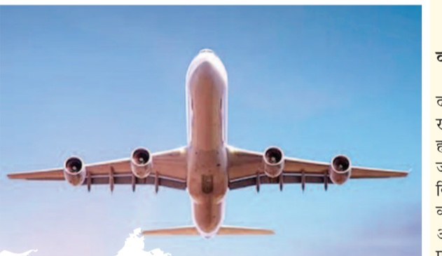
झगड़ा कर रहा है और आपातकालीन निकास द्वार खोलने की कोशिश कर रहा है। विमान लैंड करते ही पुलिस ने गिरफ्तार किया युवक सीडर रेपिड्स पुलिस के अनुसार, यह गड़बड़ी विमान के रवाना होने के तुरंत बाद हुई। संघीय उड्डयन प्रशासन के बयान के अनुसार, विमान को सीडर रेपिड्स हवाई अड्डे की ओर मोड़ दिया गया और सुरक्षित रूप से वहां उतार दिया गया। पुलिस ने बताया कि विमान के लैंड करते ही पुलिस ने विमान में सवार 23 वर्षीय ओमाहा निवासी युवक को गिरफ्तार कर लिया। स्काईवेस्ट एयरलाइंस का मुख्यालय यूटा राज्य में है। यह कंपनी यूनाइटेड, डेल्टा, अमेरिकन और अलास्का एयरलाइंस जैसी प्रमुख एयरलाइनों के लिए उड़ानें संचालित करती है। स्काईवेस्ट द्वारा जारी एक बयान के अनुसार, बाद में विमान वृहस्पतिवार रात को डेट्रॉइट के लिए रवाना हुआ।

सीडर रेपिड्स। अमेरिका से एक चौंकाने वाली खबर सामने आई है। नेब्रास्का से डेट्रॉइट जा रही क्षेत्रीय एयरलाइन्स के विमान में एक यात्री फ्लाइट अटेंडेंट से झगड़ पड़ा। उसने हवा में ही विमान का आपातकालीन निकास द्वार खोलने की कोशिश की, जिसके चलते विमान की पूर्वी आगेवा में आपात लैंडिंग करानी पड़ी। दरअसल, स्काईवेस्ट एयरलाइंस की फ्लाइट संख्या 3612 ने वृहस्पतिवार (स्थानीय समयानुसार) शाम 5:30 बजे ओमाहा, नेब्रास्का से डेट्रॉइट के लिए उड़ान भरी थी। विमान के पायलट ने शाम 6 बजे सीडर रेपिड्स स्थित पूर्वी आगेवा हवाई अड्डे के एयर ट्रैफिक कंट्रोल (एटीसी) टावर से संपर्क किया और एक यात्री द्वारा व्यवधान पैदा करने के कारण लैंडिंग का अनुरोध किया। लाइवएटीसी द्वारा रिकॉर्ड किए गए ऑडियो के अनुसार, पायलट ने कहा, 'वह अभी हमारी फ्लाइट अटेंडेंट से