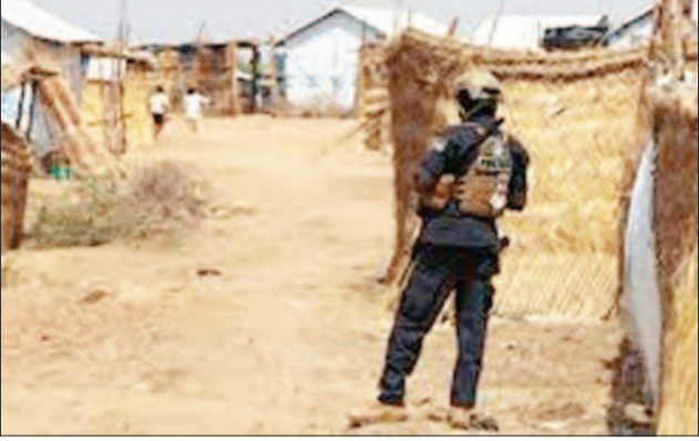
(आरएसएफ) के बीच लंबे समय से चल रहा तनाव खुलकर संघर्ष में बदल गया। इस हिंसा में अब तक 40 हजार से ज्यादा लोगों की जानें जा चुकी हैं और यह दुनिया का सबसे खराब विस्थापन और भुखमरी संकटों में से एक बन गया है। हाल के महीनों में ज्यादातर संघर्ष दारफुर और कोरडोफान क्षेत्रों में हुआ है। संयुक्त राष्ट्र मानवाधिकार कार्यालय ने गुरुवार को पुष्टि की कि आरएसएफ ने 10 जुलाई से अब तक