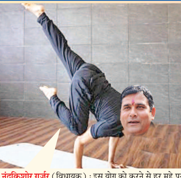
नंदकिशोर गुर्जर (विधायक) : इस योग को करने से हर मुद्दे पर टक्कर लेने की शक्ति मिलती है। फिर टक्करों से बड़े-बड़े अधिकारी जनपद से बाहर कर दिए जाते हैं।