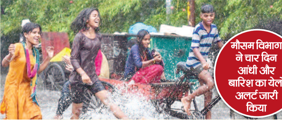
सामान्य से 4.6 डिग्री कम 34.2 डिग्री सेल्सियस दर्ज किया गया। बीते 24 घंटे में हवा में नमी का न्यूनतम स्तर 65 फीसदी रहा।

आंधी के दौरान हवा की स्पीड 50 किलोमीटर प्रति घंटा तक पहुंच सकती है। बुधवार को दिनभर सूरज और बादलों के बीच आंख मिचौली का खेल चलता रहा। हालांकि, बदरा नहीं बरसे, ऐसे में लोगों ने उमस वाली गर्मी महसूस की। अधिकतम तापमान