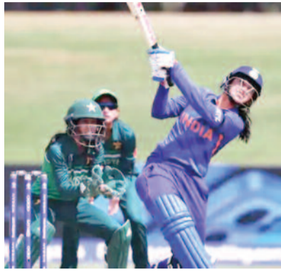
मेजबानी मिली थी।

दुबई। इंटरनेशनल क्रिकेट काउंसिल (आईसीसी) ने विमेंस वर्ल्डकप 2025 का शेड्यूल जारी कर दिया है। इसके अनुसार, भारत और पाकिस्तान की टीम 5 अक्टूबर को आमने-सामने होगी। यह मुकाबला कोलंबो के आर प्रेमदासा स्टेडियम में खेला जाएगा। टूर्नामेंट का आगम 30 सितंबर 2025 को होगा। वैसे तो भारत को इस टूर्नामेंट की मेजबानी दी गई है, लेकिन पहलगायम आतंकी हमले के बाद भारत की ओर से चलाए गए ऑपरेशन सिंदूर के कारण पाकिस्तानी टीम का भारत आना मुश्किल है। ऐसे में यह मैच कोलंबो में कराने का फैसला लिया गया है। चैंपियंस ट्रॉफी से पहले आईसीसी के सामने बीसीसीआई और पीसीबी ने न्यूट्रल वेन्यू पर खेलने के लिए सहमति जताई थी। भारत 12 साल के बाद पहली बार विमेंस वर्ल्ड कप की मेजबानी करने जा रहा है। पिछली बार इंडिया को 2013 में विमेंस वर्ल्ड कप की