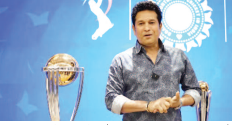
मैदान कप के जरिये 50 गांव में विकसित होंगे मैदान