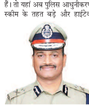
कार्यालय भी बनाए जा रहे हैं। इसी कड़ी में जानकारी मिली है कि पुलिस कमिश्नरेट गाजियाबाद के सिटी जॉन में बड़ी संख्या में निर्माण कार्य शुरू हो चुके हैं। तो यहां अब पुलिस आधुनिकरण स्क्रीम के तहत बड़े और हाईटेक

करंट क्राइम : दमकल विभाग उत्तर प्रदेश की ओर से बनाए जा रहे हैं। इस फायर स्टेशन में जहां बड़ी संख्या में फायर स्टेशन भवन का निर्माण होगा, तो वहीं पुलिस के 24 परिवारों के रहने के लिए यहां आवासीय प्लैट की सुविधा भी दी जाएगी। जो सिंगल यूनिट पर बनाए जाएंगे। इसमें अलग-अलग स्तर के पुलिस अधिकारियों को प्लैट आवंटित किया जाएगा ताकि वह परिवार के साथ यहां रह सकें।