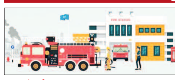
गौरव शशि नारायण