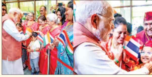
प्रदान भी किया गया। इस दौरान विदेश मंत्री डॉ. एस जयशंकर भी मौजूद रहे। बैंकॉक में गार्ड ऑफ ऑनर : पीएम