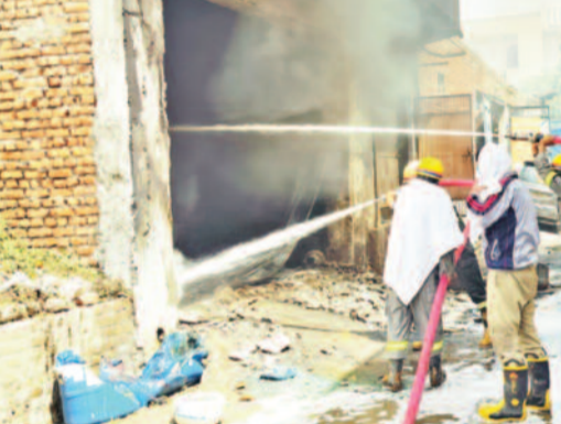
आग लगने के कारणों का पता लगाया जा रहा है। पेंट गोदाम