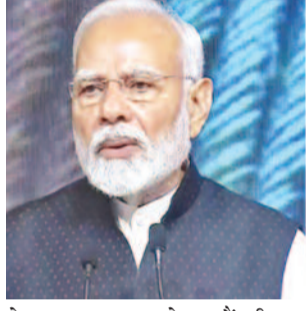
से हालात भयावह हो गए हैं। पीएम मोदी ने म्यांमार के सेना प्रमुख से फोन पर बात कर संवेदना जताई है। पीएम

पीएम मोदी ने एक्स पर लिखा कि एक करीबी मित्र और पड़ोसी के रूप में भारत इस कठिन समय में म्यांमार के लोगों के साथ एकजुटता से खड़ा है। ऑपरेशन ब्रह्मा के तहत आपदा राहत सामग्री, मानवीय सहायता, खोज और बचाव दल को प्रभावित क्षेत्रों में तेजी से भेजा जा रहा है।