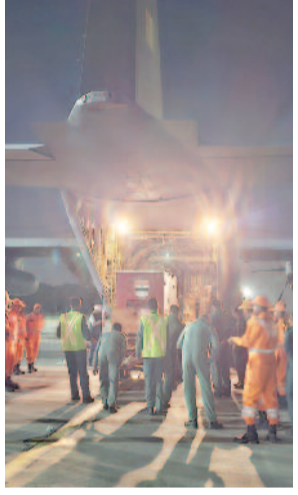
गाजियाबाद, करंट क्राइम : म्यांमार में भूकंप की तस्वीरें और वीडियो भारत में बैठे लोगों को भी डरा दे रहे हैं। तो भारत ने फिर एक बार पड़ोसी देश की मदद के लिए हाथ आगे बढ़ाए हैं। इसी