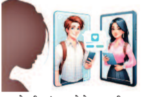
मामले की जांच करने के साथ ही रुपए फ्रीज कराने का काम शुरू कर दिया है। पत्नी से तलाक के बाद डेटिंग

नोएडा करंट क्राइम। डेटिंग ऐप पर प्यार और उसके बाद निवेश के नाम पर दिल्ली की एक मल्टीनेशनल कंपनी के डायरेक्टर से 6 करोड़ 52 लाख 51 हजार रुपए से अधिक की टगी हो गई। लगातार और रुपए मांगने के बाद उन्हें शक हुआ तो उन्होंने बात करने वाली महिला की प्रोफाइल को चेक किया तो वह फर्जी निकली। जिसके बाद पीड़ित ने इस मामले में साइबर थाने में रिपोर्ट दर्ज कराई है। पुलिस ने