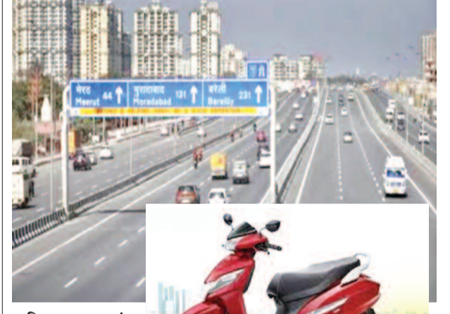
गाजियाबाद, करंट क्राइम। अपर जिलाधिकारी (नगर) गाजियाबाद, गम्भीर सिंह ने कहा कि