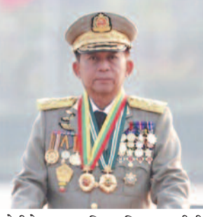
मोदी ने एक्स पर लिखा कि एक करीबी मित्र और पड़ोसी के रूप में भारत इस कठिन समय में म्यांमार के लोगों के

साथ एकजुटता से खड़ा है। ऑपरेशन ब्रह्मा के तहत आपदा राहत सामग्री, मानवीय सहायता, खोज और बचाव दल को प्रभावित क्षेत्रों में तेजी से भेजा जा रहा है। म्यांमार में आए विनाशकारी भूकंप के बाद भारत ने शानिवाक 'ऑपरेशन ब्रह्मा' शुरू किया। देश मंत्री एस जयशंकर ने कहा कि भारत ने म्यांमार के लोगों के लिए तत्काल मानवीय सहायता की पहली खेप भेजी है। सी-130 विमान कंबल, तिरपाल, स्वच्छता किट, स्लीपिंग बैग, सोलर लैंप, भोजन के पैकेट और रसोई सेट